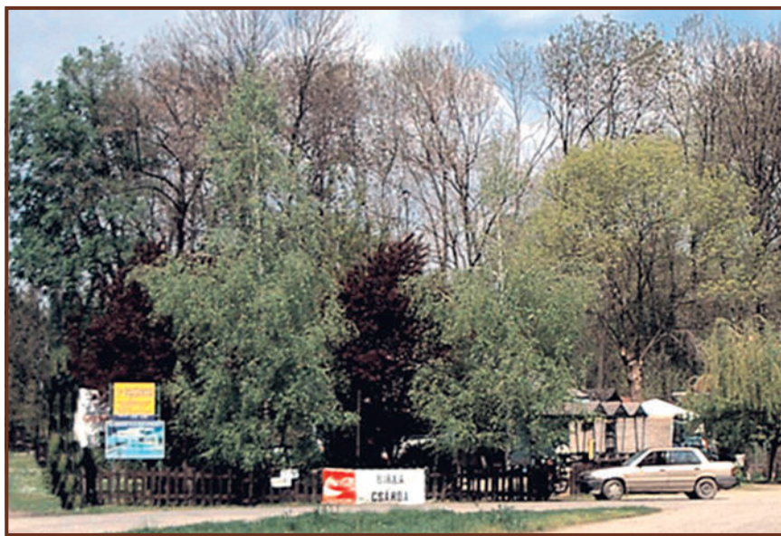
A lacházi Dunapart legismertebb tájékozási pontja a Birka csárda volt