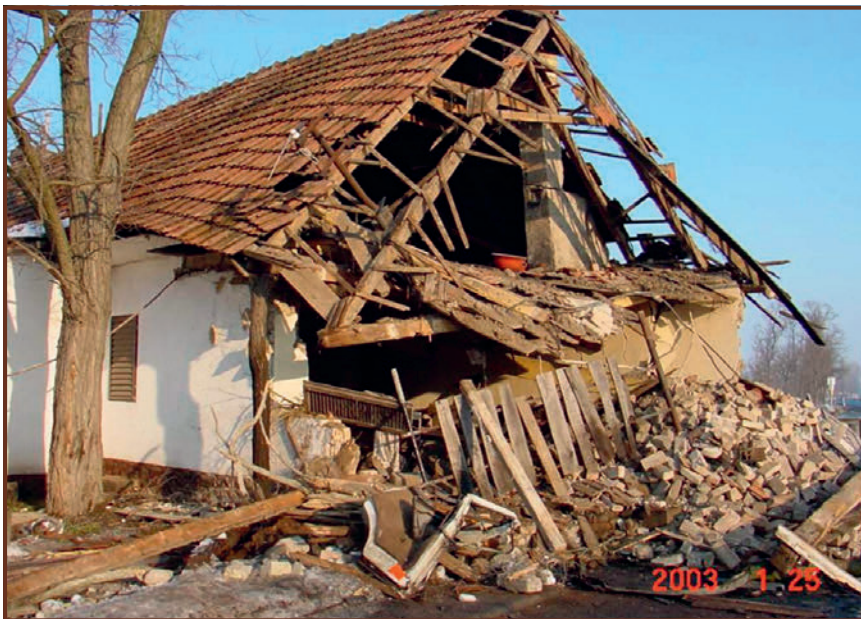
A Levegő csárda romjai az autós tragédia után