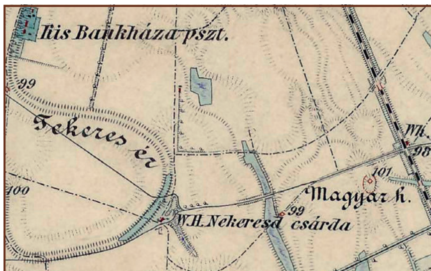
A Nekeresd csárda a Szentiványi út mentén (W.H.= Wirtshaus=kocsmá)