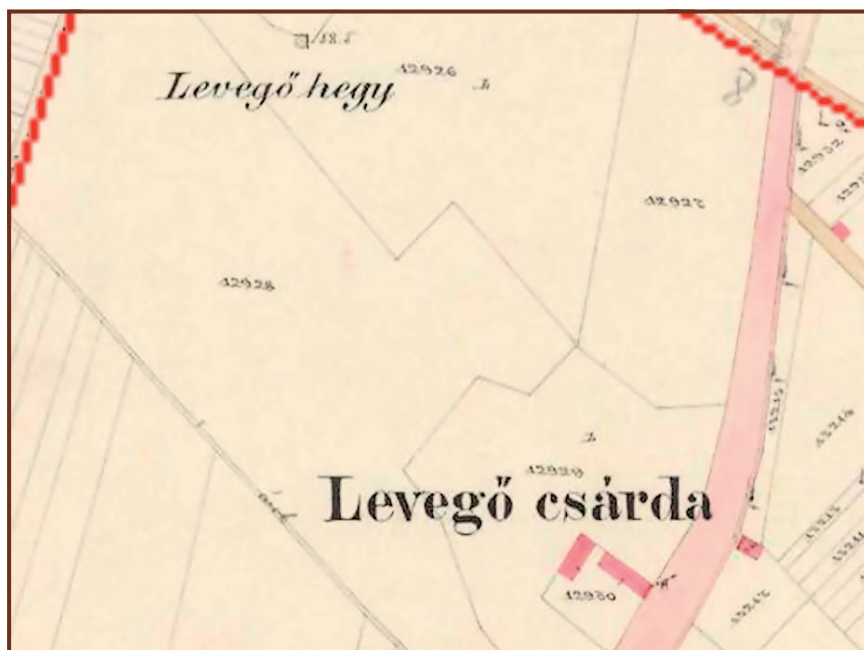
A Levegő csárda és névadója az 1880-as kataszteri térképen

A csárda újkori történelmét csak 1939 szeptemberétől ismerjük, amikor