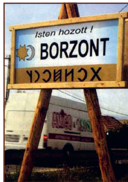
Borzont település helynév táblája

5 éves hadifogsága alatti történelemsokról mondta: „...találkoztam turáni rokonainkkal, baskírokkal, votjákokkal, osztjákokkal, kalműkökkel, cseremi-