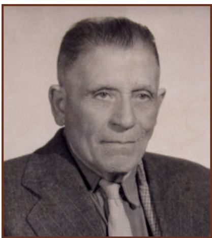
A nyugdíjas tanár 1958-ban

https://magyarmegmaradasert.hu/files/k_aktatar/fa_er_2.pdf http://adatbank.transindex.ro/html/cim_pdf2442.pdf file:///C:/Users/user/Downloads/rem_2%20(1).pdf https://hargitanepe.eu/brassai-tanarur-es-a-csiki-muveszeti-neveles/ https://en.mandadb.hu/common/fileservlet/document/332255/default/doc_url/magyar_irok_elete_es_munkai_XVII_kotet.pdf http://misc.bibl.u-szeged.hu/46326/1/hargitavaralja_1937_044_048.pdf