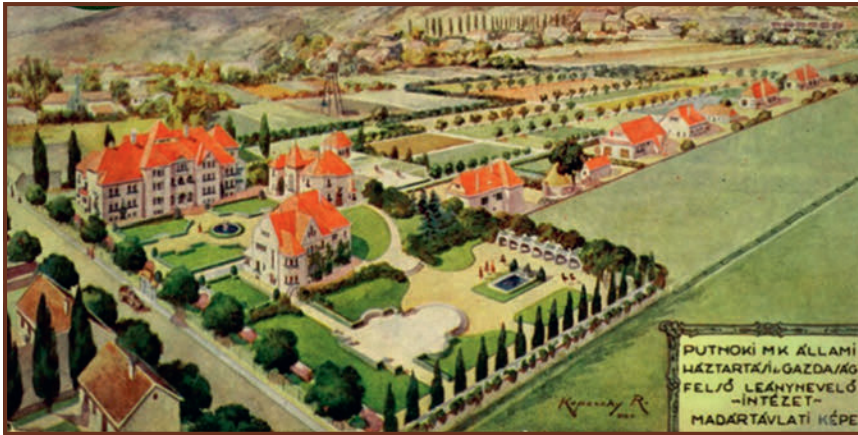
A putnoki M. K. Állami Felső Leánynevelő Intézet madártávlati képe