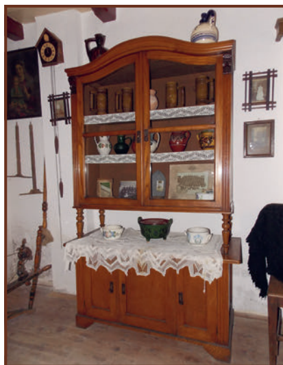
Almárium.