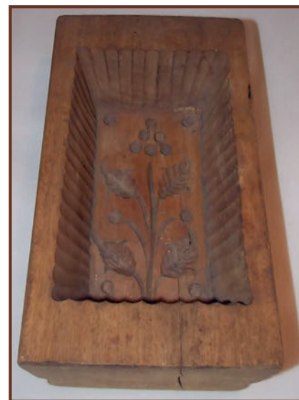
Vajnyomó minta.

Népművészetünk díszítő technikájának változatossága legjobban a guzsalyokon figyelhető meg. Nálunk a talpas guzsaly, mint a fonás egyik eszköze volt a legdíszítettebb használati tárgy. Tájházunkban őrzött guzsalyoknak a készítője nem egyszerű falusi fűrő-faragó ember lehetett, hanem olyan mesterember, aki gondosan megtervezte a talp és a szár mintázatát, és aztán szépen megmunkálta a guzsaly egész felületét.