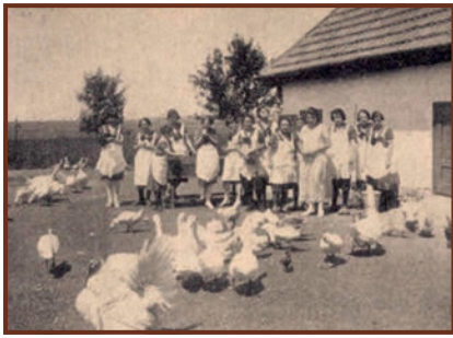
A putnoki gazdasági iskola baromfiudvara