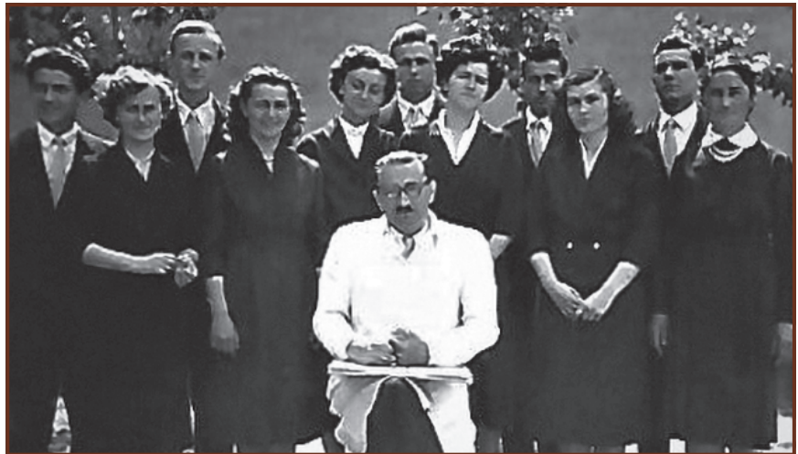
Ballagáskor a gimnázium udvarán, 1957. május 8.

vésnek bizonyult az ötven perc. Orosz nyelvi óráin irodalmi művek is előkerültek. Például A revizor című Gogol-mű egy-egy részletét fordítottuk. Még irodalmi est megrendezésére is vállalkozott velünk, fiúosztállyal. Arany János – Shakespeare – Szimonov művek részleteit adtuk elő. S még nem szóltam arról a három napos kirándulásról, amelynek egyik felejthetetlen része volt a Pesttől Mohácsig tartó hajóút.