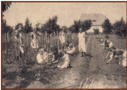
A putnoki gazdasági iskolában kötözik a szőlőt