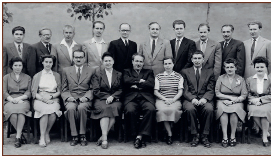
A Lehel Vezér Gimnázium tanári kara 1957-ben