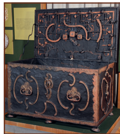
A Jászkun Hármas Kerület privilégialis ládája a Jász Múzeum gyűjteményében

1731-ben a Pesten építendő invalidus, vagyis a rokkant katonák kórházára összegyűlt pénzalapból az Udvari Kamara végül kifizette a Német Lovag-