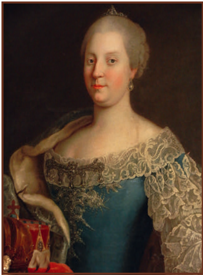
Mária Terézia királynő

visszaszerezzék régi szabadságukat. Ennek fejében még ezer lovas katonát is ki kellett állítaniuk a királynő szolgálatába. Ez volt a híres jászkun huszárzred.