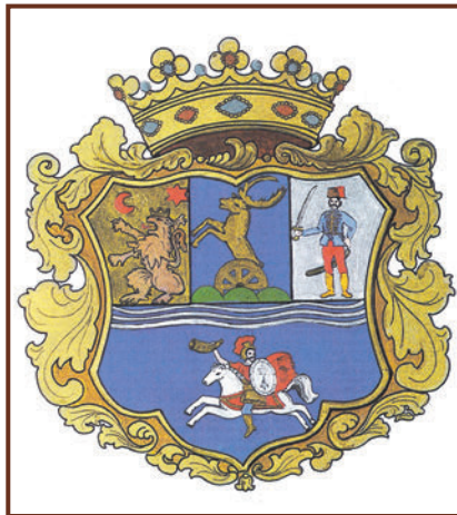
A Jászkun Kerület címere

tésbe kezdtek, óriási kölcsönöket vettek fel. A jászok még a Jázsáságot kapuit is megnyitották a betelepülni vágyó felvidéki kismesek előtt. Végül összegyűlt az a hatalmas summa, amely némi kamattal mintegy 580.000 rhénesi, vagyis rajnai aranyforintot tett ki, s ebből a Jázsáságra 227.750, a Nagy-kunságra 155.000, a Kiskunságra 185.150 rajnai aranyforint esett.