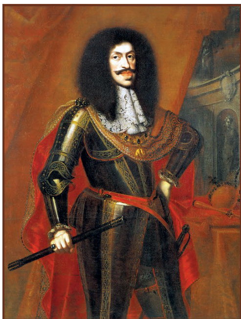
I. Lipót császár

A jászok és kunok legnagyobb ünnepe május 6-a, ezen a napon emlékezünk őseink példanélküli nagy tetterére, a Jászkun Redemptiora. A rendszerváltozás után elsőként Jászfákóhalmán rendeztek ünnepséget az önmegváltás napján, majd 2001-től Jászberényben, a Városvédő és Szépítő Egyesület is tartott megemlékezést a Kapitánykertben. Amikor 2005-ben a jász települések közös összefogásával elkészült a Jász-emlékmű, ettől kezdve az egyesület a szobornál emlékezett meg a jeles eseményről. Az ünnepséghez ekkor már Jászberény Város Önkormányzata is csatlakozott, a jász települések pedig