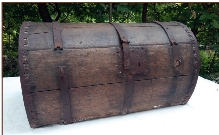
A fülöpszállási deputációs láda

generációk váltása, az őrzési viszonyok különbözősége következtében a papír vagy pergamen alapanyagú tárgyakat megviselték az évszázadok próbatételei. Amely tárgy túlélte a háborúk, tűzvészek, költözködések, selejtezések pusztításait, az szépen lassan, de megtalálta végleges helyét a közgyűjteményekben. Kisebb százalékuk családok őrzésében, gyűjtők tárlóiban pihennek. A megszállott gyűjtő pedig mindig reménykedik egy-egy érdekesebb relikvia előkerülésében, melynek lapjain a régmúlt üzenete rejtőzhet.