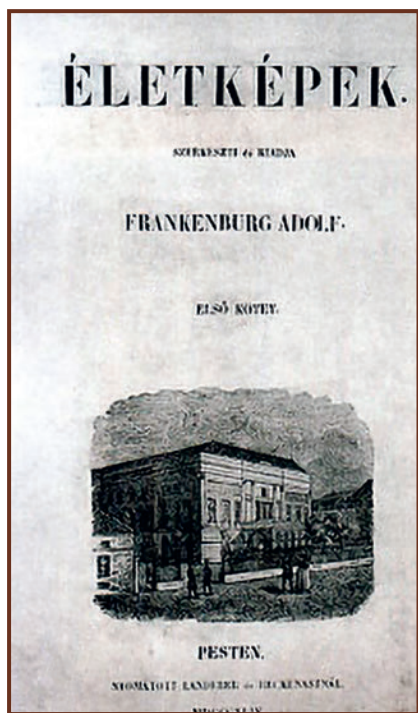
Frankenburg szerkesztette Életképek

Cikkei megjelentek a Felsőoktatási Szemlében, az Antik Tanulmányok című lapban. Néhány cikkének a címe: Nevelőink feladata , Korszerű nevelésünk , Korszellem és mesevilág , Az ifjúság olvasmányairól , A tanári te-