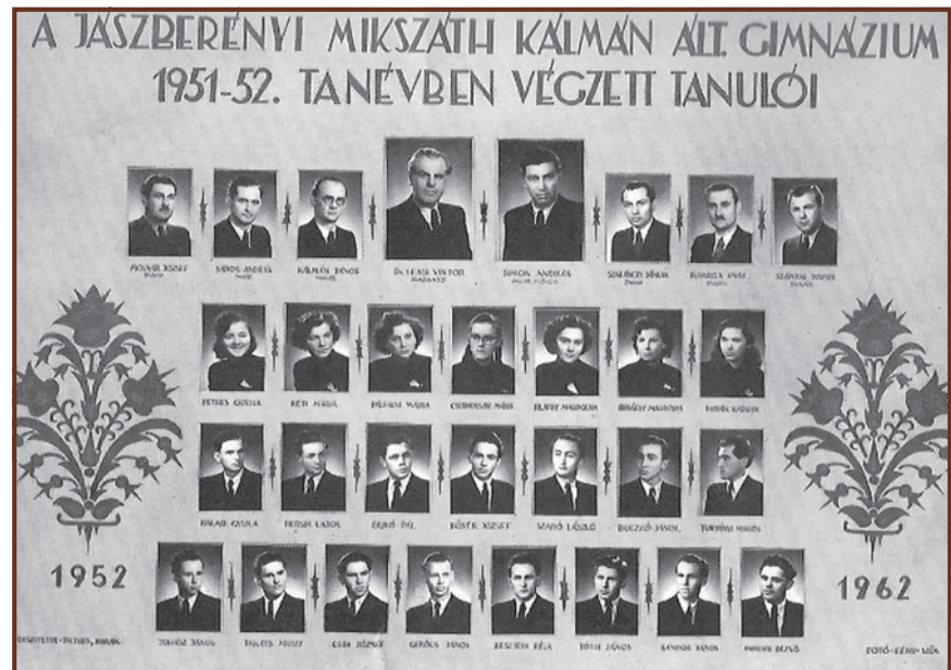
Az utolsó tabló Jászberényben

A következő és egyben utolsó munkahelye az egyetem (JATE) klasszika-filológia tanszéke, ahol adjunktusként