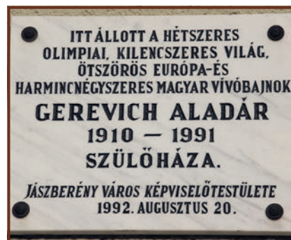
Gerevich Aladár emléktáblája az egykori szülői ház helyén álló épület falán

Képes Sport, 1954-11-23 / 28. sz. Népsport, 1953-07-31 / 152. sz. Syposs Zoltán: Villanó pengék. Sport, Budapest, 1975