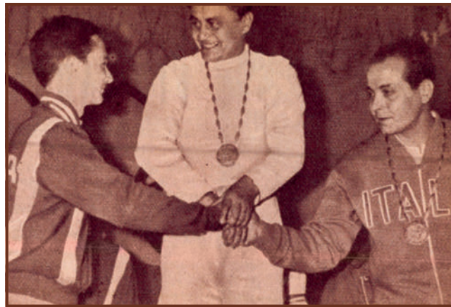
Hetedszer az olimpiai dobogó tetején