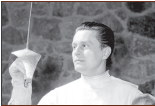
Gerevich Aladár 1956 tavaszán · Fotó: MTI – Komlós Tibor