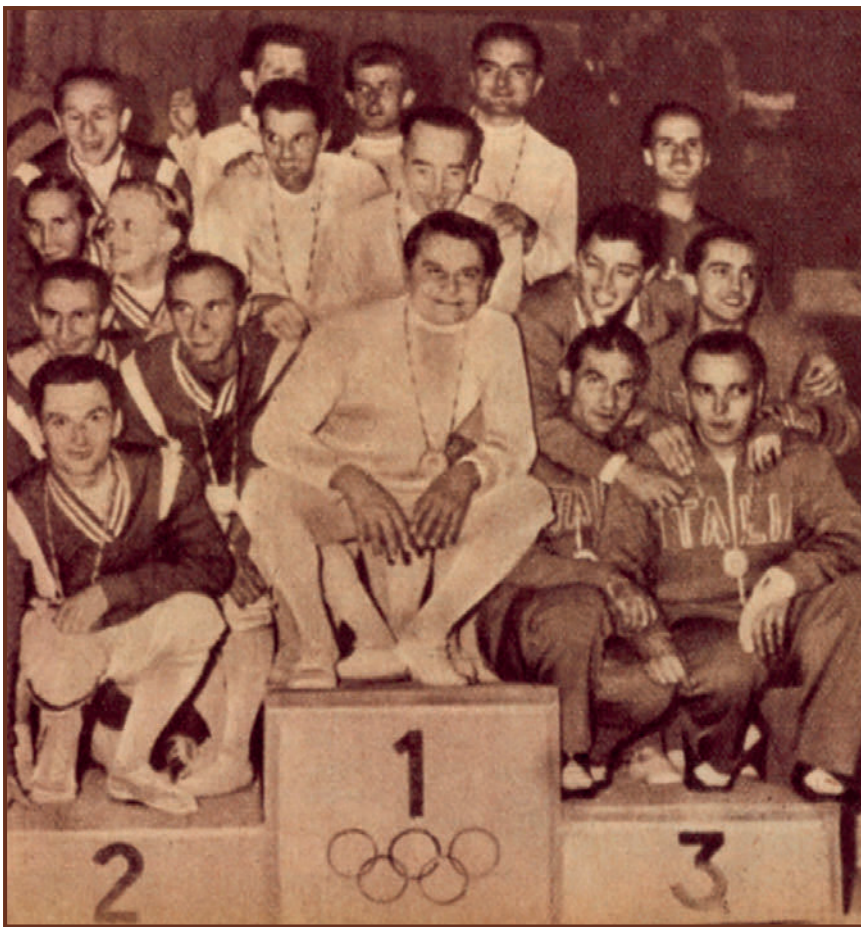
Egy nagy vívó visszavonul.

A kitűnő sportember az 1948-as olimpiai egyéni aranyérem megszerzése után megkapta Jászberény szülővárosa díszpolgári címét, de ezt a 1970-es évek folyamán nem erősítették meg, és így elvesztette azt. Jászberényben hosszú ideig megfeleltek róla, mígnem 1992-ben a város pótolta az emlékezést, és a tisztelgést nagy szülöttjéről, és az augusztus 20-i ünnepségen díszpolgári címet kapott. Utcát neveztek el róla, és emléktáblát avattak azon a helyen, ahol szülőháza állott. Abban a házban, ahol éltek – Budapest, I. kerület Attila út 39. – egy emléktábla örökíti meg 2010-től Gerevich Ali bácsi és felesége emlékét.