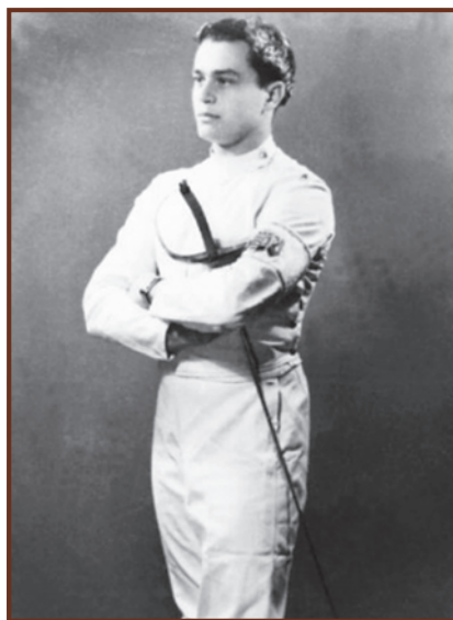
A fiatal vívó Gerevich Aladár

„Csak úgy kíváncsiságból mentem le egyszer apámhoz a vívóterembe, miután többször beszélt az otthoniaknak tanítványairól és a vívóeseményekről” – elevenítette fel Gerevich Aladár a diákkori emlékeit.