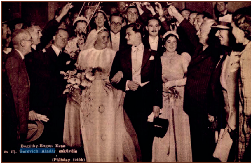
Az esküvői pár éppen a vívók sorfala közt és kardjaik alatt halad el

sorozatban, de a mindent eldöntő utolsó asszóját elsöprő lendülettel nyerte meg. A csapatgyőzelemmel meglett az ötödik olimpiai aranyérme.