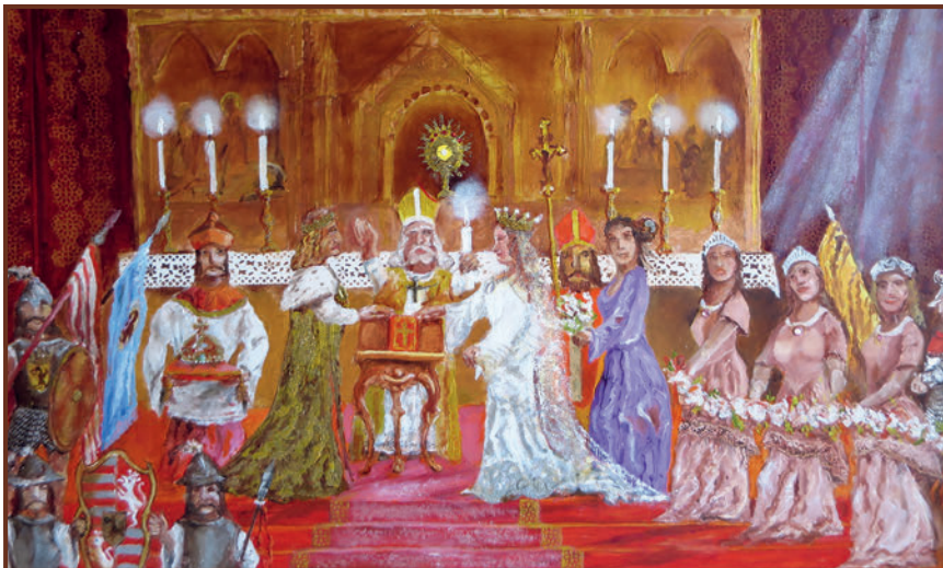
Kiss Bertalan: Mátyás király esküvője