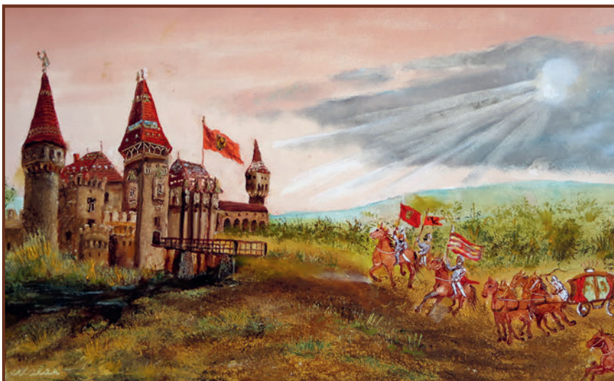
Kiss Bertalan: Vajdahunyad vára