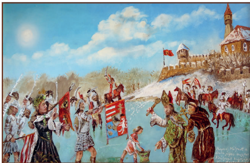
Kiss Bertalan: Mátyást a Duna jegén magyar királynak kiáltják ki

Újabb fordulatként V. László 1457 végén betegségben meghalt. Így Mátyást 1458 elején – a Duna jegén – királlyá