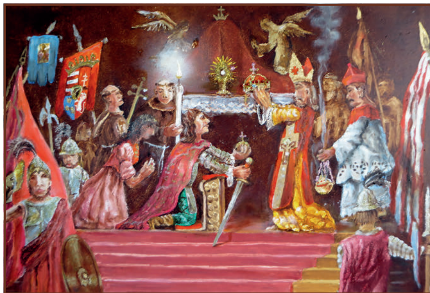
Kiss Bertalan: Mátyás megkoronázása Székesfehérvárott

nek hívják. Az alkotás ezt a templombelső próbálta meg felidézni. Mivel az 1464-es állapotot értelemszerűen nem ismerhette, a Művészettörténeti Értesítő 1996/3-4. számát vette alapul, és egy