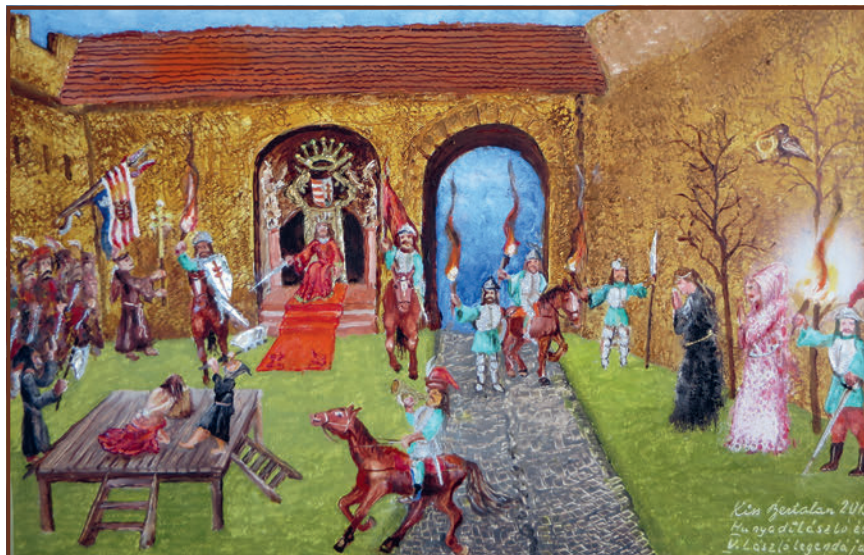
Kiss Bertalan: Hunyadi László lefejezése

aki először színleg behódolt. Később aztán Cilleit Nándorfehérvárra csalták, és ott tisztázatlan körülmények között meggyilkolták. Az akkor Hunyadi