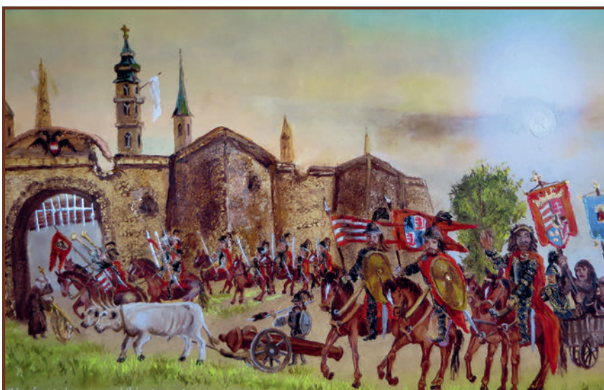
Kiss Bertalan: Bécs ostroma