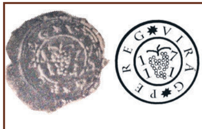
Pereg első pecsétnyomata és rajzolata 1711-ből

Azonban 1972-ben a 700 éves jubileumi évfordulót követően a Levente Egyesület logóját fogadták el címerként, ami sajnos napjainkban is használatban van még. Pereg címere viszont tökéletesnek mondható heraldikai szempontból. A peregi címerben szereplő szőlőlevél és -fürt a legrégebbi