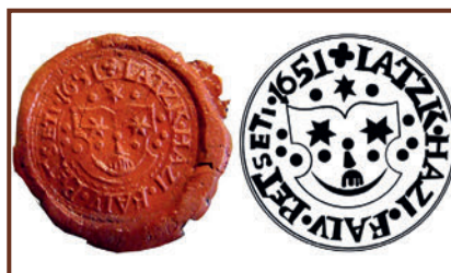
Az 1651-es pecsétnyomat és rajzolata

Lacháza legrégebbi címere az 1651-es viaszpecséten szerepel, melyet Horváth Lajos ekképpen ír le a Pest megye városi, községi és megyei pecsétjei, 1381–1876 (Budapest, 1982) című munkájában: „keréktalpú szimmetrikus tárcsapajzson, a holdsarlón trónoló Szűz Mária, vállai mellett egy-egy gyöngy, azok felett egy-egy hatágú csillag.”