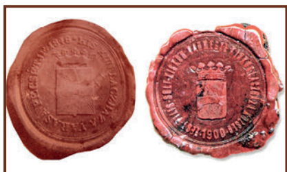
Viaszpecsét (negatív lenyomat) 1848 és 1900-ból változatlan címerrel

Az 1929-ben alapított lacházi Levente Egyesület zászlaján szereplő logó az