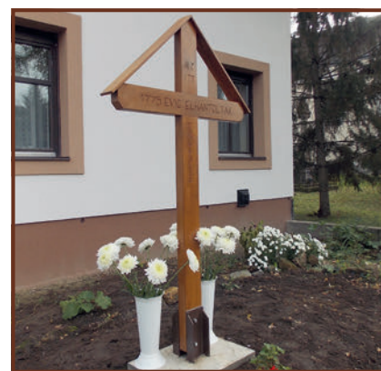
A kegyelet keresztje.