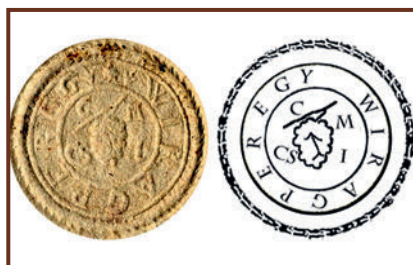
Szlovákos pecsétnyomata és rajzolata, mely 1728–36 között volt használatban C M Cs I = Célunk Mindig Csak Isten (Našim cieľom je vždy len Boh)

pecsétnyomatok szimbóluma alapján készült a történelmi hűséget követve. Ugyanis a 17-18. század fordulóján a Peregre betelepült szlovákok a szőlőtermesztés magas színvonalú kultúráját is magukkal hozták.