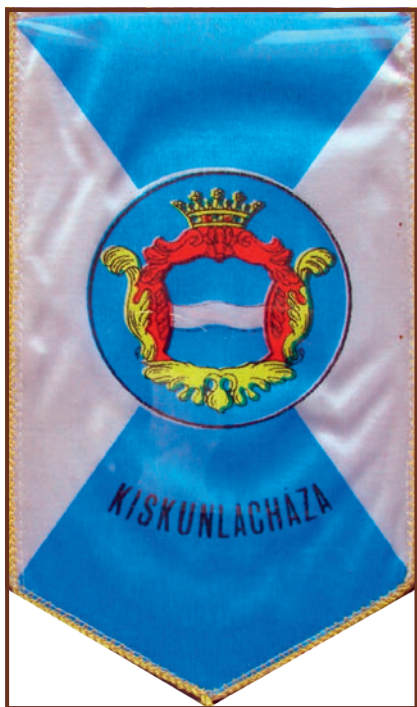
A címer torzított változata a Kiskunlacházi Községi Motoros Klub zászlaján

Azonban 1972-ben a 700 éves jubileumi évfordulót követően a Levente Egyesület logóját fogadták el címerként, ami sajnos napjainkban is használatban van még. Pereg címere viszont tökéletesnek mondható heraldikai szempontból. A peregi címerben szereplő szőlőlevél és -fürt a legrégebbi