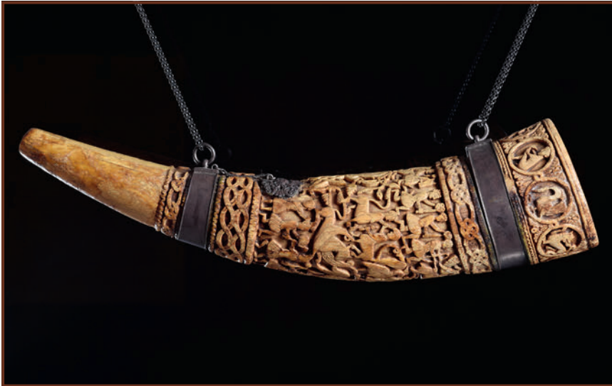
Jászkürt – Lehel kürtje

A moldvai csángókhöz hasonlóan szorongatott helyzetben élnek magyarok többfelé a Kárpát-medencében. Generációk sorsát befolyásolhatjuk azzal, ha megerősítjük bennük az anyanyelv