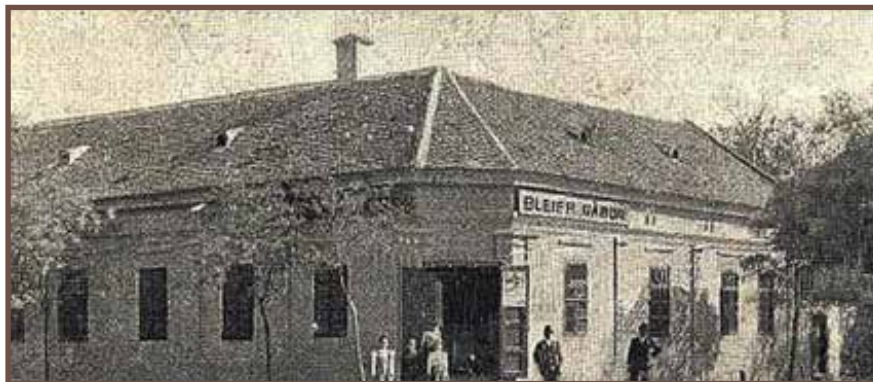
Bleier Gábor üzlete (Dózsa György út 70.)