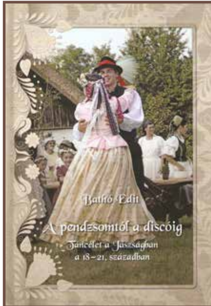
A pendzsomtól a discóig c. könyv borítója

A Jász Múzeum és Alapítványa méltán híres könyvkiadásának gyönyörű terméke a kiváló stílussal megírt könyv, mely tartalmában elmélyült kutatásokról, tapasztalati tudásról és a téma