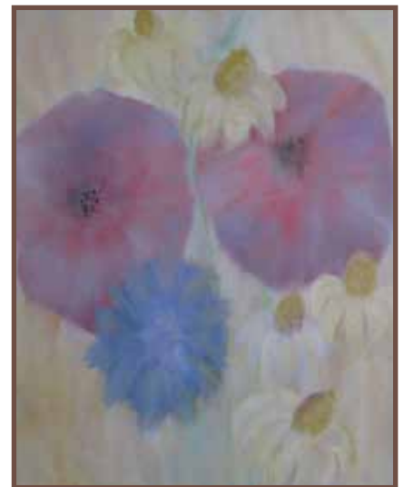
D. Kovács Júlia - Pipacsos csendélet

A műterem lakásának falait díszítő képei közül több is a szülőföldhöz