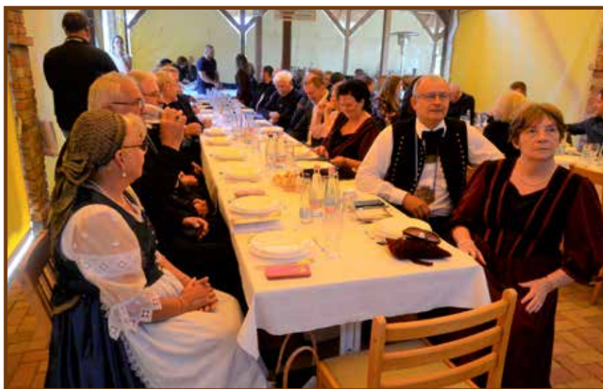
Az ünnepség résztvevői