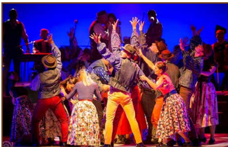
Részlet a műsorból