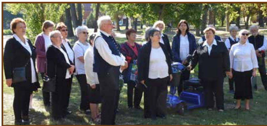
A jászberényi Kossuth Népdalkör az emlékünnepeken