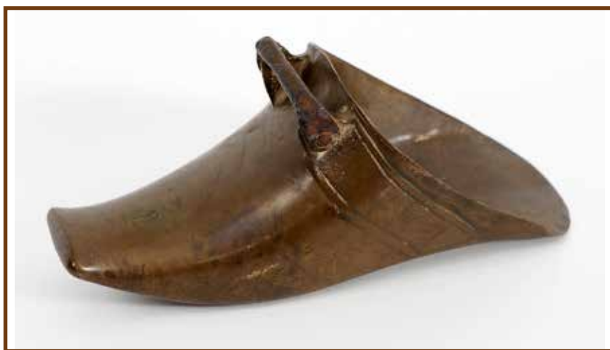
Török kengyel, egy padlásról került elő

régészettel, néprajzkutatással foglalkozó szakembereknek nemigen van idejük padláson, pincében, kamrában keresgélni, antikváriumokat, régiségboltokat járni, gyűjtőkkel csereberélni. Pedig igazi kincsek ezen esetekben is előkerülhetnek. A helytörténész kicsit hasonlít a