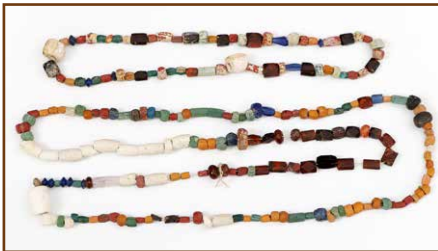
Nagy mennyiségű színes gyöngyöt, edényeket és csontokat fordított ki az eke az 1950-es években az első Tsz mélyszántáskor Kunszentmiklós északi részén