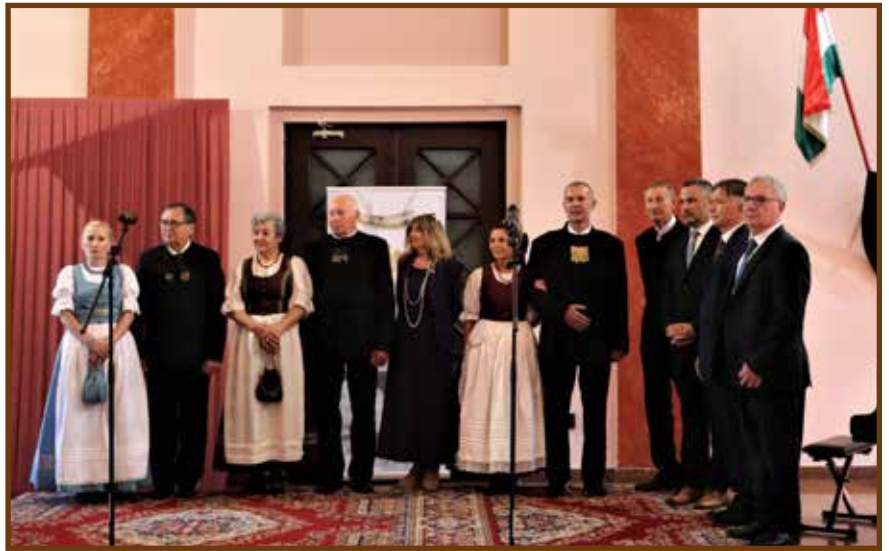
A Jászság képviselői az ünnepségen