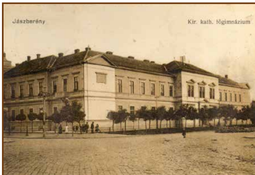
A jászberényi Királyi Katolikus Főgimnázium

Jászberény város társadalmi és politikai életében aktívan részt vett. A város képviselő testületének és a főgimnázium tanbizottságának tagja,