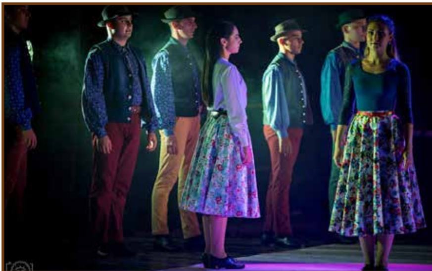
Részlet a műsorból

Sajnos a pandémia miatt 2020-ban nem tudták átadni a díjat, így ebben az évben Pakson pótolták az elmaradást. A tagozat elnöksége a 2020-ban a kiskunhalasi Thorma János Múzeumnak, 2021-ben pedig a jászberényi Jász Múzeumnak ítélte oda a Poroszlai Ildikó emlékplakettet kiemelkedő munkájuk elismeréseként.