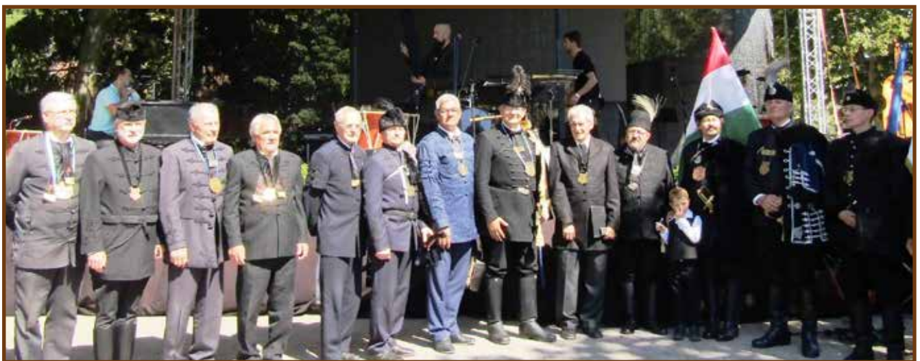
Jász-, nagykun- és kiskunkapitányok Berekfürdőn