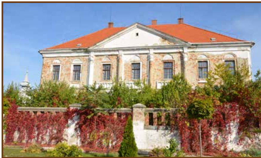
A premontrei rendház a felújítás előtt

ről hozott telepeseket, és elkezdte a templom teljes felújítását. Abban az időben nyerte el mai formáját, és a középkori falmaradványokat elfedve a templomot kibővítve, barokk stílusúvá lett a templom. A nyugati főbejáratnál épült a torony, a főbejárat