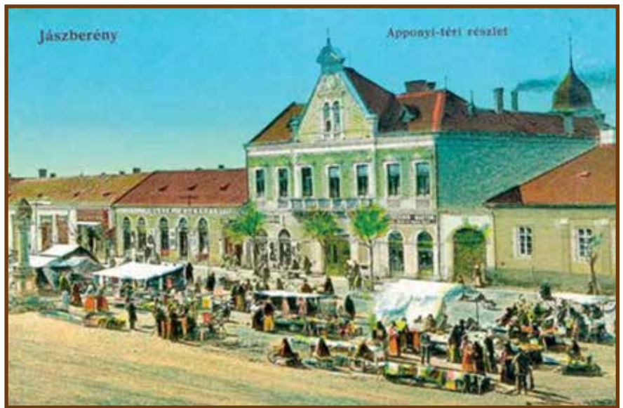
Jászberény főtere a 19. század végén

tett. Réz Kálmán bácsi vezette be azt a hagyományt, aki megérinti a jászok nevezetes kürtjét, azt egy kis ceremónia keretében tiszteletbeli jászsá avatják. Ez is megtörtént Móricz Zsigmonddal, tiszteletbeli jász