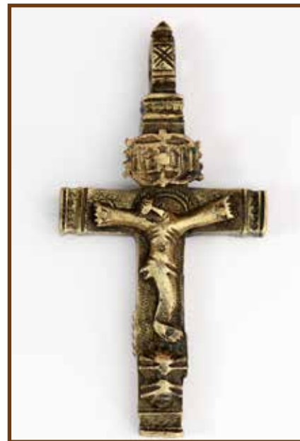
Nyakba akasztható korpusz, csatornafektetéskor került felszínre

Kunszentmiklósi házamban őrzöm a Felső-Kiskunság legjelentősebb hely-