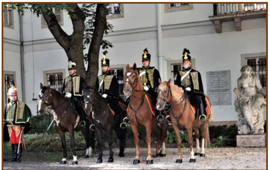
Az isaszegi Szent Márton Lovasklub huszárjai