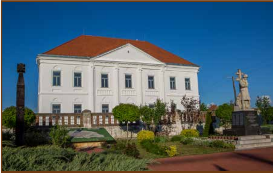
A felújított premontrei rendház

A rendház átadás rendezvényét kultúrműsor követte, az ünnepélyes szalag átvágás után Fazakas apát úr felszentelte a felújított rendházat. A megnyitás után a megjelentek körbe járhatták a termeket, amelyekben különféle kiállításokat nézhettek meg.