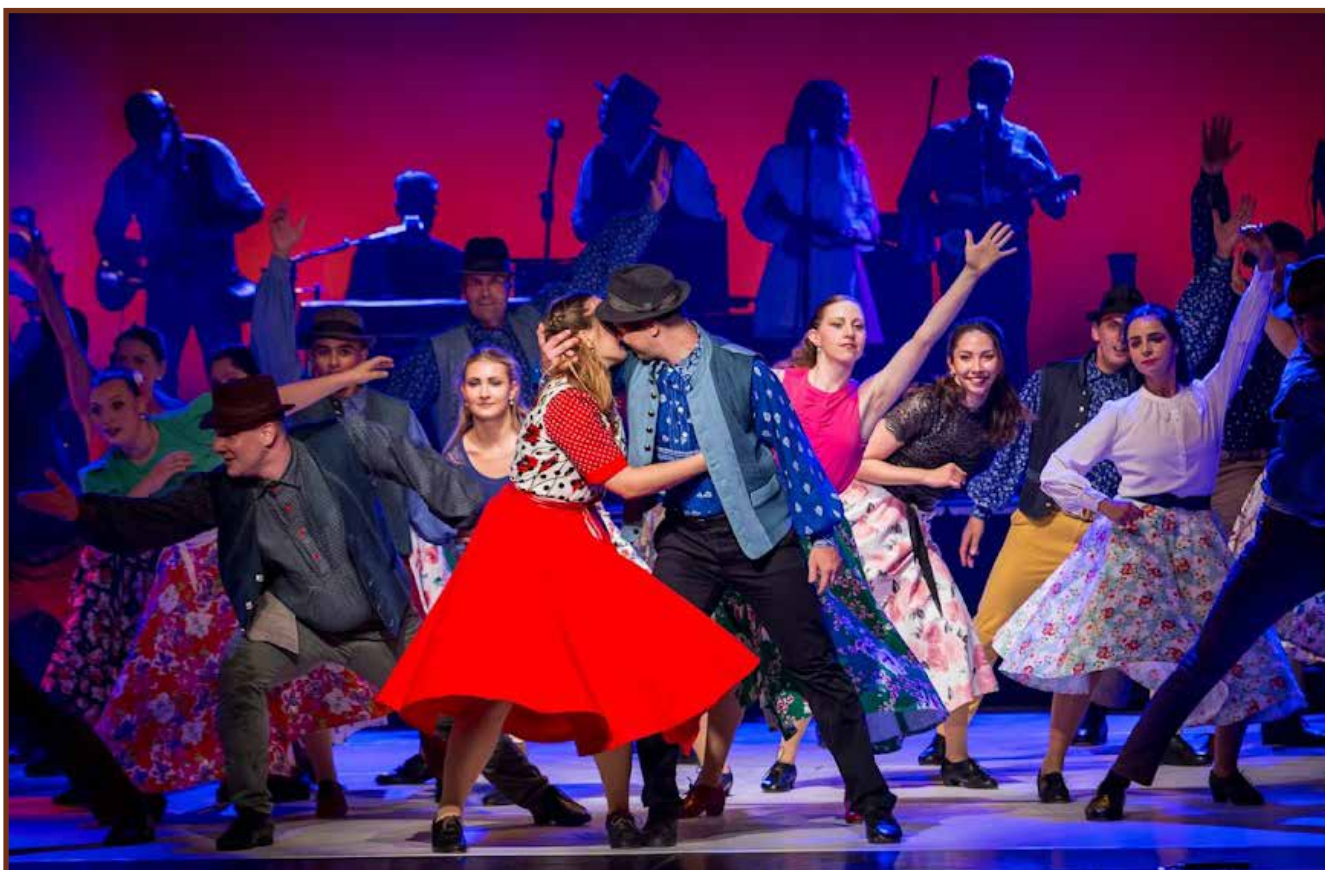
Részlet a Jászság Népi Együttes Mindenek Szerelme című táncműsorából

REDEMPTIO (latin szó, ejtsd: redempció) – visszavásárlás, megváltás, önmegváltás. A szó az 1745-ös Jászkun Redemptiora utal, amikor a jászok és a kunok példás összefogással, saját erejükből visszavásárolták kiváltságaikat Mária Terézia magyar királynő 1745. május 6-án írta alá a jászok és a kunok redempcionális diplomáját.