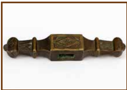
Fokos fej, talán Rákóczi kurucai használhatták

A szennyvíztisztító közelében szarmata leletek rejtőznek, feltárásukat későbbre halasztották a régészek.