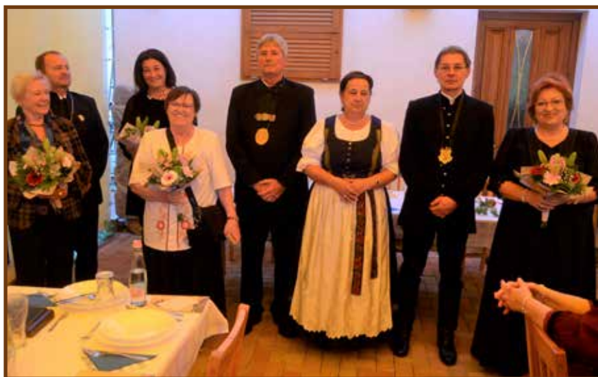
A regnáló kapitányok és szakmai segítők