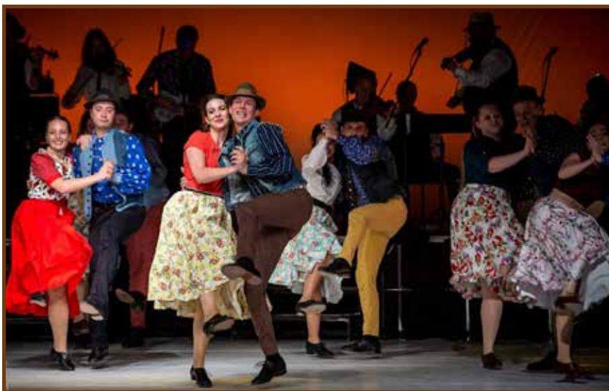
Részlet a műsorból