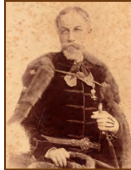
Jókai Mór író

A nap a gasztronómiai élvezetek szellemében telt. A sült szalonna és a házi szilvás sütemények mellett a legfinomabbnak a szilvalekváros kenyér bizonyult – természetesen a frissen főtt lekvárból mártogatva.