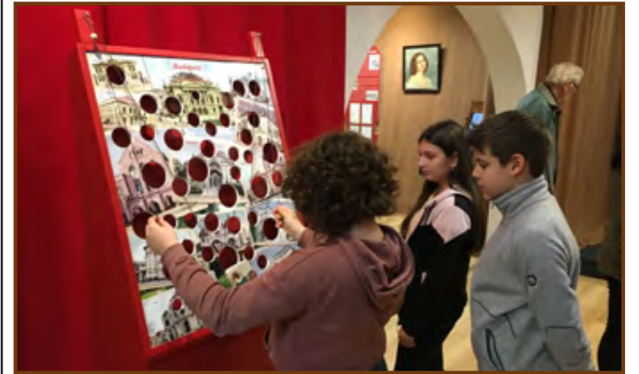
Interaktív játék a kiállításban