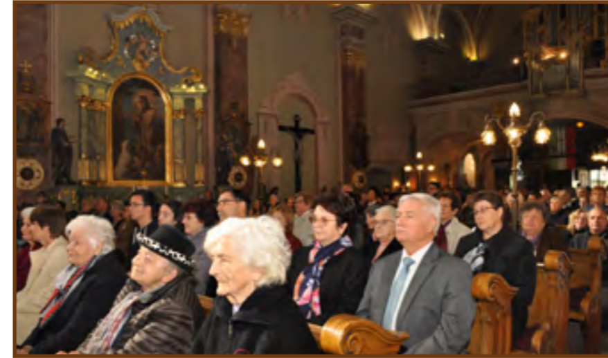
Az ünnepi szentmise résztvevői

bennünket. A főpásztor az istenke- reső Ady Endre versét idézte: „Nap- sugarak zúgása amit hallok, számban nevednek jó íze van, Szent mennydör- gést néz a két szemem, Istenem, Istenem..”