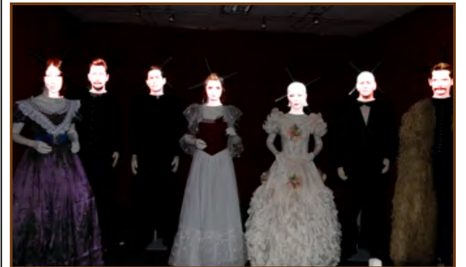
A hét művész egy színpadon a holorotor segítségével