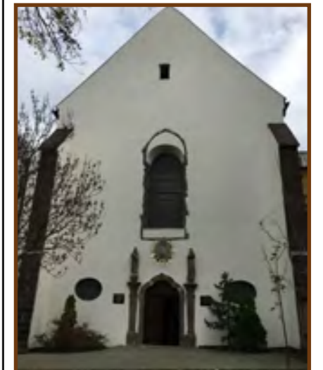
A Ferences templom felújított főbejárata