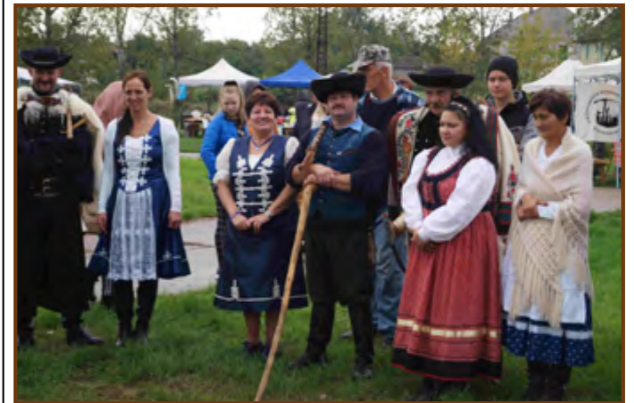
Főzőversenyben résztvevő csapatok a pásztortűz gyújtásra várva