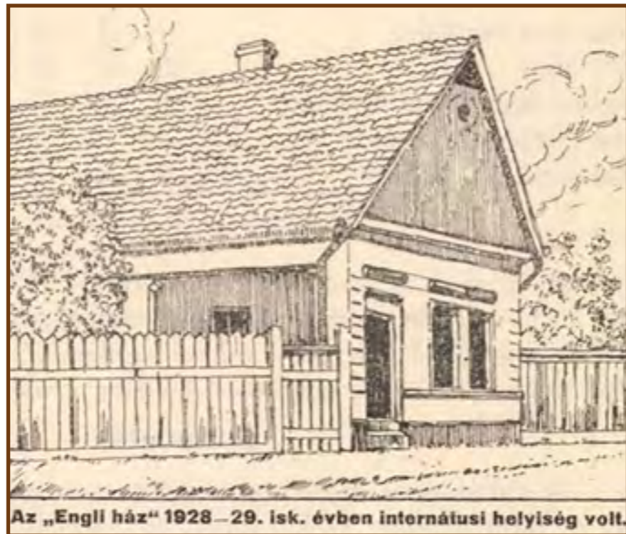
Az „Engl ház” 1928–29. isk. évben internátusi helyiség volt.