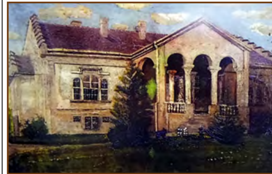
A Kégl-kastély 1940-ben

nyomait még erősen magán viselő bábolnai ménes parancsnoki tisztét. 1943-ban tábornokká léptették elő, és ekkor már a Földművelésügyi Minisztériumban az egész ország lótenyésztéséért volt felelős. 1944-ben a front és a szovjet tankok közeledtével Pettkó-Szandtner Tibor kapcsolatait kihasználva a tenyészállomány válogatott egyedeit, körülbelül 400 példányt Bergstettenbe menekítette, abban a hitben, hogy így megmentheti a ménes értékes génállományát.