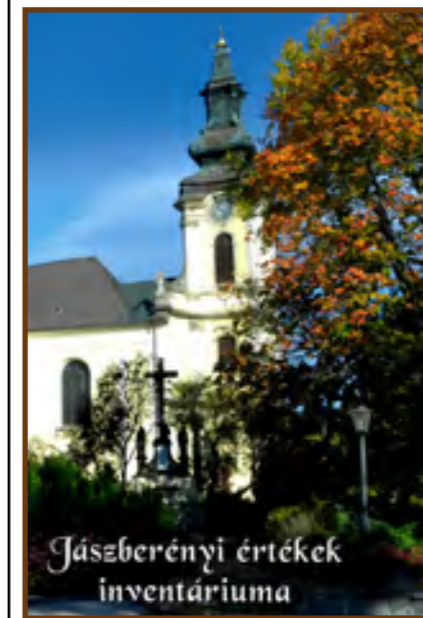
A könyv címlapja

A múzeum számos felbecsülhetetlen értéke közül kiemelkedik nemzeti ereklyénk, a Jászkürt, Lehel kürtje , amely 2020-ban megkapta a Kiemelkedő Nemzeti Érték minősítést. A Hamza Gyűjtemény és a Szikra Galéria a jászsági képzőművészet bemutatásának fontos színterei. A könyvtár, a Zeneiskola mellett a Jászkerület Nonprofit kft. fontos kultúra közvetítő és közösségteremtő szerepet tölt