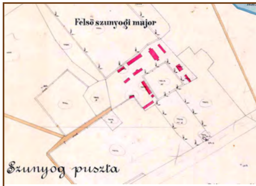
A Szunyog pusztai majorság

Kégl Sándor halálát követően mintegy 400 hold (~ 2,3 km 2 ) birtok szállt gyermekeire, amelyben 372 hold szántóföld, 1 hold kert, 2 hold szőlő, 1 hold rét, 10 hold legelő, 7 hold erdő, 3 hold nádas és 14 hold földadó alá nem eső terület tartozott a kúriával és a majorsági épületekkel együtt, melyekben minta-tehenészet, csikónevelde és sertésnevelés működött. Ez a vagyon közepes földbirtok volt (1000 hold felett beszélünk nagybirtokról) a környező birtoktestek között: Hajóséknak 1590, Mocsáriéknak 600 és Únyiéknak 220 holdnyi volt a földjük.