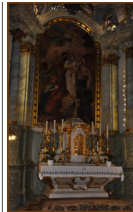
A főoltár jász mintával hímezett terítővel