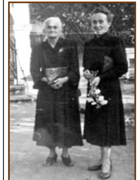
Anyja és lánya az 1950-es években

Sírhelyük a Fehértói temetőben található (II. Parcella, 6 sor 14-es sírbolt), a fehér obeliszken csak a Friedvalszky családnév olvasható.