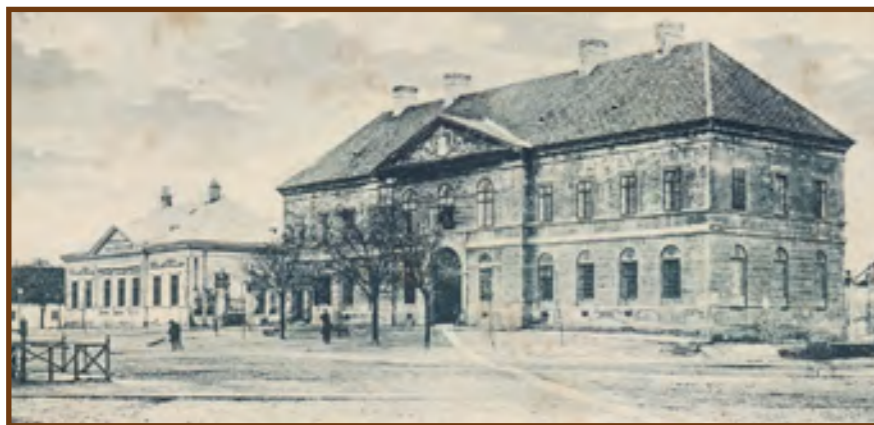
A kunszentmiklói városháza. Az emeleti nagyteremben hegedült egykor Reményi Ede

Világpolgár, de igazsívú magyar hazafi volt. 1828. január 17-én született Miskolcon Hoffmann Ede néven, egy szerény körülmények között élő csizmadia fiaként. Igen fiatalon Pyrker János egri érsek segítségével a Bécsi Konzervatóriumban tanulhatott. Várta a siker Európában, de a magyar szabadságharc kitörése hallatán, 1848 nyarán hazatért, és a szabadságharcosok közé állt. A Délvidéken a szerbek ellen harcoló nemzetőrökhez csatlakozott.