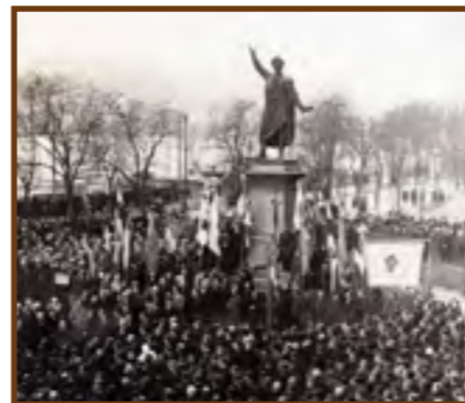
Ünnepség a budapesti Petőfi szobor előtt

1892. május 15-én San Franciscóban hangverseny közben a pódiumon érte a halál. „Repülj fecském” című szerzeménye végig kísértte koncertjein, mely ma is a zenetörténetünk örökzöld alkotása. Egész sikeres életét a magyar zenekincsek népszerűsítésére áldozta, a világ legjelentősebb színpadjait meghódította.