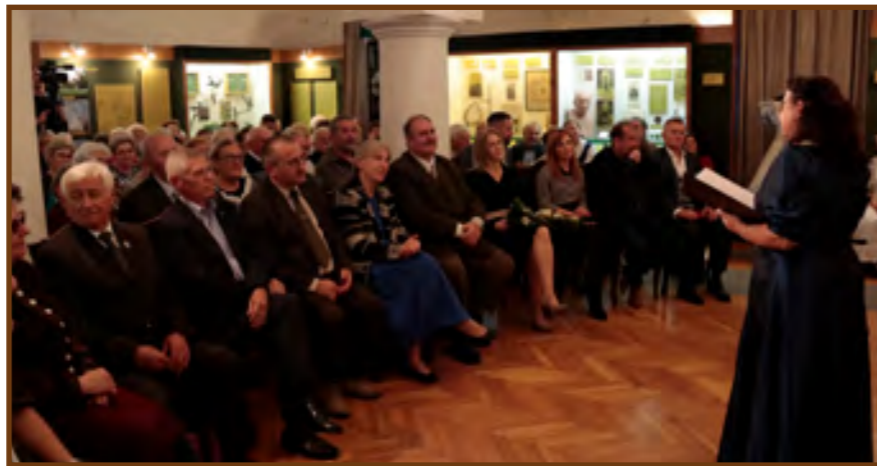
Az ünnepség résztvevői