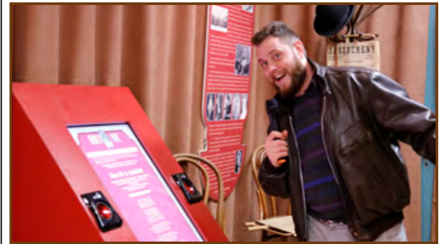
Küryokee a kiállításban