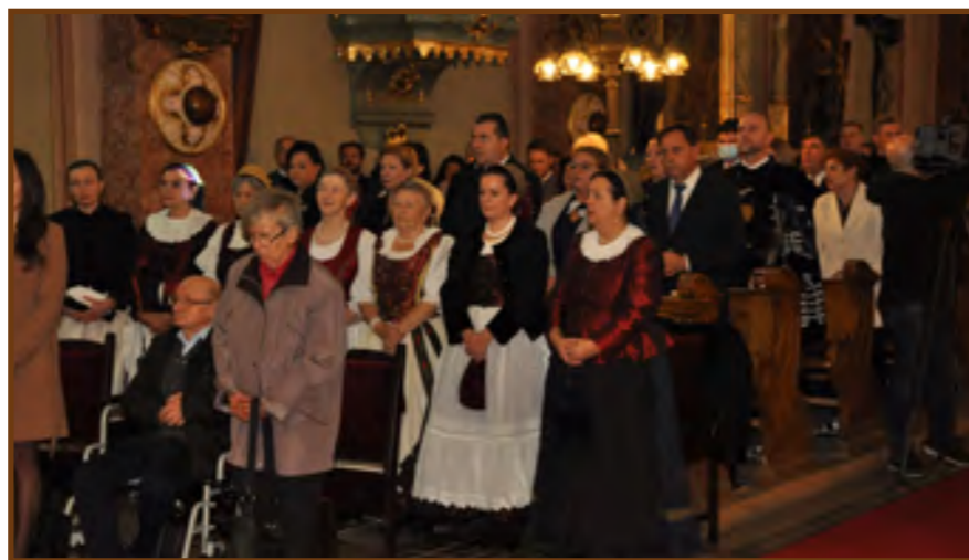
Jász viseletbe öltözött asszonyok a szentmisén