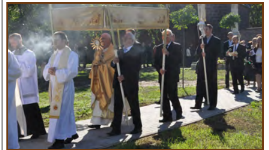
Körmenet a templom körül