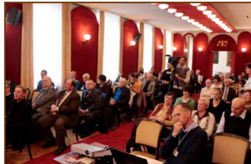
A konferencia közönsége