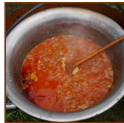
Bográcsban főtt marhapörkölt

Az időjárás nem nagyon volt kegyes hozzánk, de ennek ellenére a rendezvény jól sikerült, a meghívott vendégek nagy létszáma elfogadta meghívásunkat, a szakmai előadók, a résztvevők sokasága biztattak bennünket, hogy ebből a „Marha Jó Napból” hagyományt kell teremtenünk. Annál is inkább a településünk napjára kell tenni, hogy a rendezvény mondanivalóját tekintve, emlékezzék, tisztelgést állítsunk azoknak a kunmadarasi embereknek, pásztoroknak,