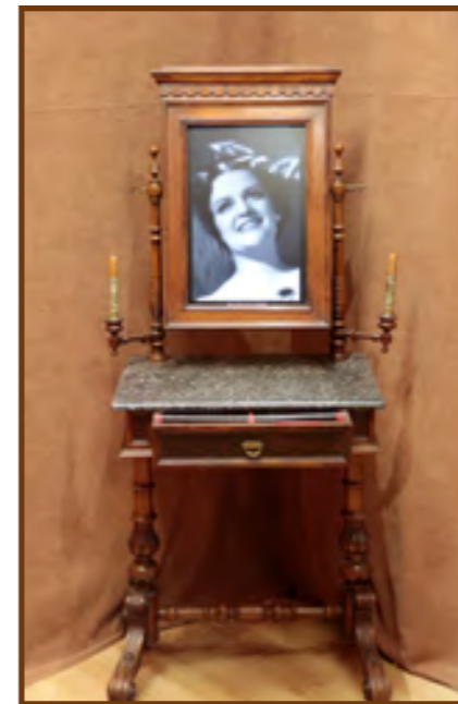
Beszélő tükör a kiállításban

A modern, interaktív tárlatot 2024. szeptember 30. napjáig tekinthetik meg az érdeklődők.