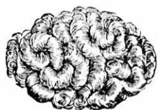
Konty lokni és hajfürt koszoru olesó árban kaphatók.