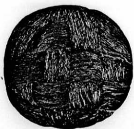
Mindenféle turbán ujdonságok hajjal és hajnélkül olesó árban kaphatók