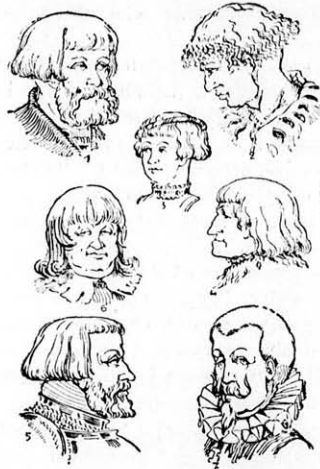
Férfi viselet a 16 században a Reformáció idejében. 1–5. Csösviselet. 6. Paraszt. 7. Spanyol nemes viselet.

alatt hosszú hullámokban volt a haj a vállra bocsátva a spanyol gallér körül. Minél hosszabbra nőtt a haj, annál kisebb lett a bajusz és szakál. A bajusz csak egy vonás lett az orr alatt és a szakál csak egy pont a száj alatt. Tehát a körszakál lassanként kiment a divatból egészen a 17. század végéig, míg a paróka korszak be nem állott.