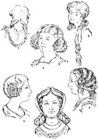
Asszonyviselet 1500. év körül. 1. és 2. Leány a 12. századba Nagy Károly idejébe. 3. Asszonyviselet a 13. századba. 4. Asszonyviselet a 14. századba. 5. Asszonyviselet a 15. századba. 6. Asszonyviselet a 15. században olasz viselet szerint.

A nőknél az előtt a haj a főkötő alá volt rejtve, most pedig újra széles hajfonatokban csüggött alá vagy pedig a leányoknál göndörítve a fül mögé volt helyezve. Divat volt ebben az időben a szélesen befert haj, amely a háton csüggött le, a fonat vége színes szalagokkal volt díszítve.