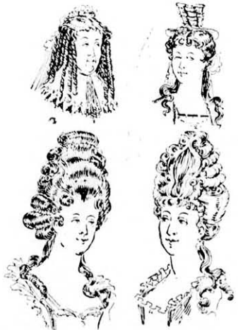
Asszonyok. 1—4. Női hajdivatok a 17. század utolsó negyedében.

E viselet különösen udvari ünnepek alkalmával volt szokásban, később pedig takarékosági szempontból kisebb lett. Megszűnt 1720-ban és helyébe lépett a haj csomag.