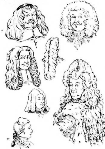
A paróka korszak kezdete. 1—3. kis Allongparóka. 4. Félhosszu Allongparóka (Klerikus) 5. Francia udvari visele. (XV. Lajos király idejében). 6. Egész hosszú Allongparóka. 7. Hajzacskó.

A homlokón magosra feltornyozva és széthasítva omlott alá a fej mindkét felén az allonge paróka egészen a mellig, hátul pedig a hát közepéig úgy hogy a váll szabadon volt.