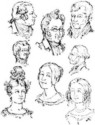
Férfiak és asszonyok a 18. század közepén. 1. Copf alkonya 2. Napoleon-viselet. 3. Biedermajer-viselet. 4. és 5. Férfi-viselet 1825—1835-ig. 6. Leányviselet a 30. évek elején 7—8. Viselet a 1830—1850. év között.

Helyrelgazítás. Lapunk legutóbbi számában a „Haj és szakál viselet története“ című közleményünk legutolsó képcsoportja technikai hibából megcserelődött. Ennélfogva itt közöljük 1820—1850-ig az akkori (Biedermajer stílus) haj és szakálviseleteket.