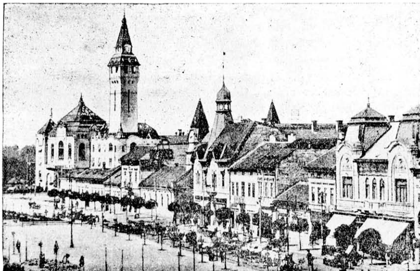
1914 január 6-án, vízkereszt napján országos fodrász verseny és székely fodrászgyűlésnek Marosvásárhelyen való rendezése alkalmából Marosvásárhelynek egyik részletét bemutattuk olvasóinknak. Ez egy részlete a székely metropolinak.

A szép ünnepély, a nemes versengés, annak megmutatása, hogy iparunk is termel művészeket, tán meg nyitja valamennyiünk szívét, s az egész székelyföld minden szakmabelijapasa egyesülhet talán egy nagy székelyföldi Szövetségben. Mert már megalakulásunkkor is ez volt a kiinduló terv: összehozni egy nagy Szö-