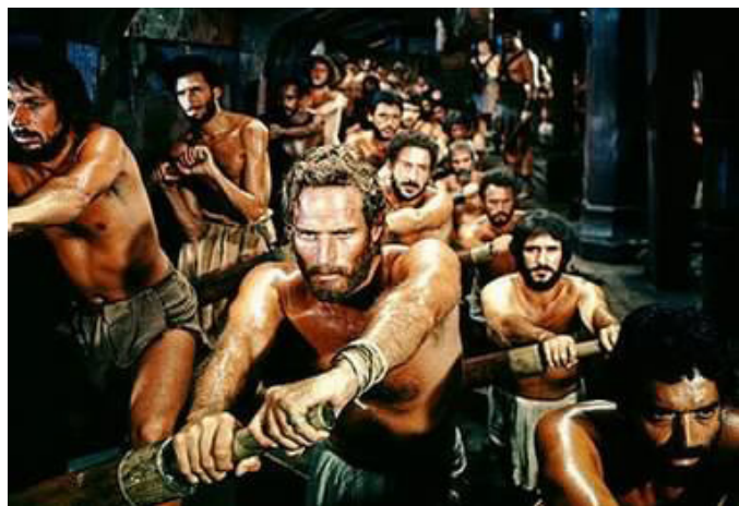
Részlet a Ben-Hur című filmből

A magyarországi események tiltakozásra indították a protestáns országokat. Holland, svéd, angol hivatalos közbelépés történt a bécsi udvarnál a gályarab lelkészek szabadon bocsátása érdekében, elsősorban Geerard Hamel Bruyninx bécsi holland követ ténykedésével. De a hivatalos diplomácia tekervényes útjain nehezen mozdultak előre a dolgok, s az életveszélyben forgó lelkészek megsegítésére, megmentésére magánemberek kezdeményezésére is szükség volt. Nápolyban, Velencében élő, vallásukat