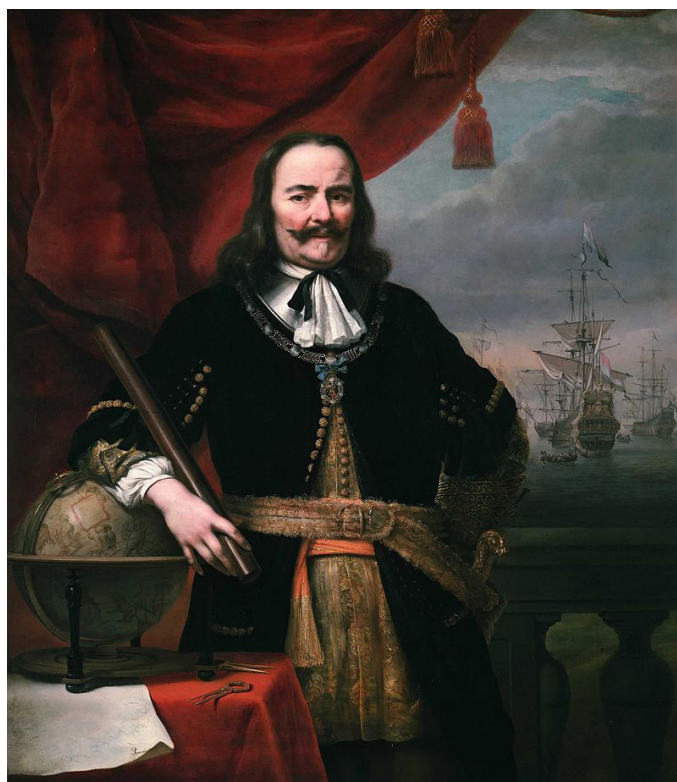
Ruyter Mihály (1607–1676) holland tengernagy, nemzeti hős, a hadtörténet legnagyobb tengernagyaik egyike

Tekintsünk most vissza a 17. századi történésekre. Római katolikus vallású főurak és főpapok összeesküvésének leleplezését használta fel a Habsburg-kormányzat arra – I. Lipót uralkodása idején –, hogy a Magyarország belső önkormányzatát biztosító törvények felfüggesztésével 1671-ben önkényuralmat vezessen be. Zrínyi Péter , Nádasdy Ferenc és Frangepán Ferenc kivégeztetése után a magyarországi katolikus klérus, élén Szelepcsényi György esztergomi érsekkel, úgy gondolta a maga és a katolikus arisztokrácia feje fölül a bécsi bosszút elhárítani, hogy az összeesküvés felelősségét egyetemlegesen a magyar protestantizmusra fogta, azzal vádolva az evangélikus és református lelkészeket, hogy ők szították a katolikus király elleni lázadást. Így nemcsak magukat menthették, hanem szabad kezet kaphattak az akkor még protestáns többségű ország erőszakos katolizálására, ami a Habsburg uralkodó érdeke is volt. (Szelepcsényi György négy év alatt 63 ezer protestánst kényszerített vissza a római egyházba.) Pozsonyban rendkívüli törvényszék alakult Szelepcsényi érsek elnöklete alatt, amely 1673 őszén beidézt 33 lelkészt és tanítót a Felvidékről és a bányavárosokból. Közülük 32 evangélikus volt, 1 pedig református. Az ellenük felhozott vád: felség sértés, hazaárulás, a római katolikus vallás meg-