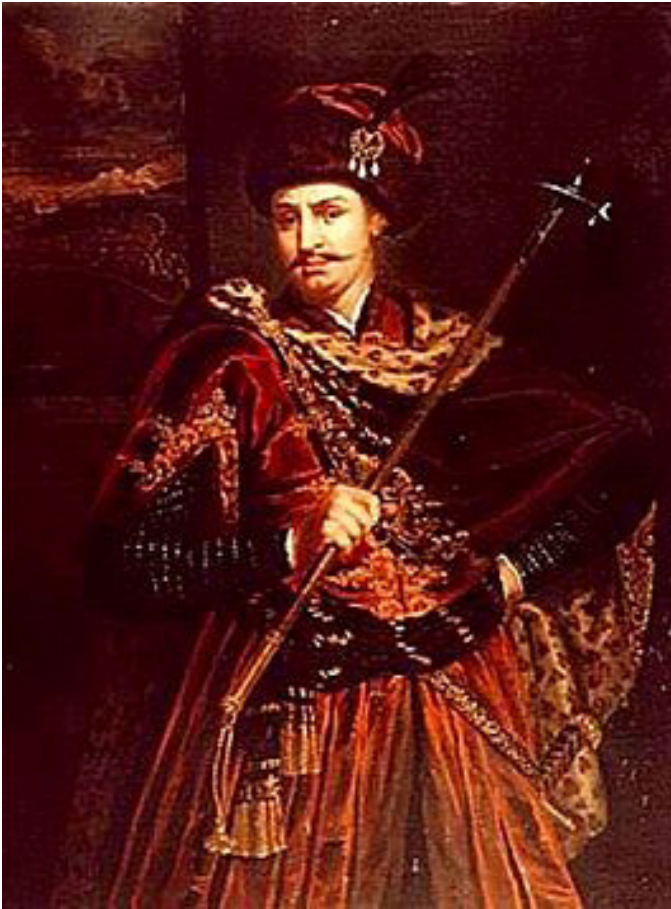
Thököly Imre magyar főnemes, kuruc hadvezér (1657–1705)

„A tömlöcből kihozatván a hollandiai követ Van Daalen Cornelius által hintóba ültetének és a hollandiai papokkal együtt felvívék őket a vicekirályhoz, az holott kitörlik neveket a halál könyvéből. Onnan vitetnek Ruyter exellenciájához, aki sok örvendezései után a maga asztalánál megvendégeli. Kinek midőn ennyi jóakarattját meg akarná köszönni Harsányi István, nem engedé, ezt mondván: Nem szükséges, tiszteletes uram, hogy a mi jóakarattunkat megköszönjék, mi itt éppen csak eszközei voltunk az Istennek. Monda Harsányi István: Az Isten eszközeinek is meg kell adni méltó becsületeket. Légyen azért dicséretes emlékezete Ruyter Adorján Mihálynak a magyarok előtt a gályán nyomorgó papoknak megszabadulásokért...”