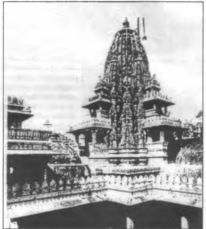
Dzsaina-templom, 13. sz. Ránakpur (India)

„Ne tévelyegjetelek, szeretett testvéreim: minden jó adomány és minden tökéletes ajándék onnan felülről, a világgosszág Atyjától száll alá, akiben nincs változás, sem fénynek és árnyéknak váltakozása.” (Jak 1:17)