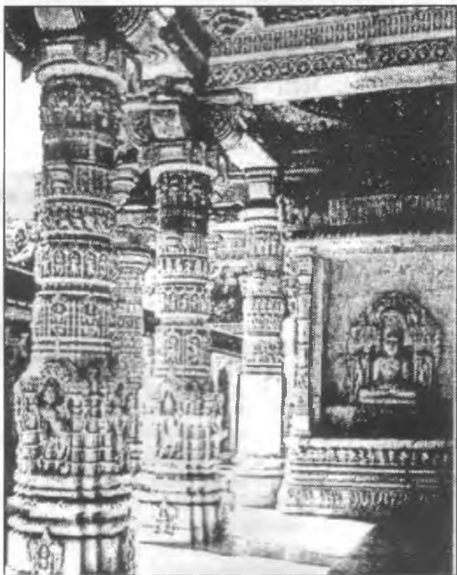
A Vimala sah-templom belső körfolyosóival. Ábu-hegy, India

„Mert ha vannak is úgynevezett istenek, akár az égben, akár a földön, mint ahogyan sok isten és sok úr van, nekünk mégis egyetlen Istenünk az Atya, akitől van a mindenség, mi is őérte, és egyetlen Urunk, a Jézus Krisztus, aki által van a mindenség, mi is őáltala.” (1Kor 8:5–6)