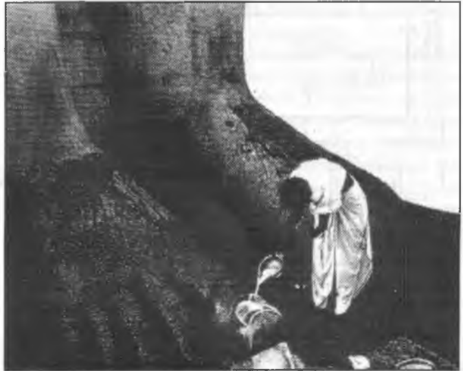
Felajánlás Bahubali hatalmas szobrának lábánál

létező egy szellemet és egy démont hordoz magában, és ezek nélkül egyáltalán nem létezhet. A természeti jelenségekben, az esőben, szélben, mennydörgésben, napsütésben is szellemek tevékenykednek. A fény szellemei jók, a sötétségé gonoszak, olyanok is vannak, akik ezekhez imádkoznak.