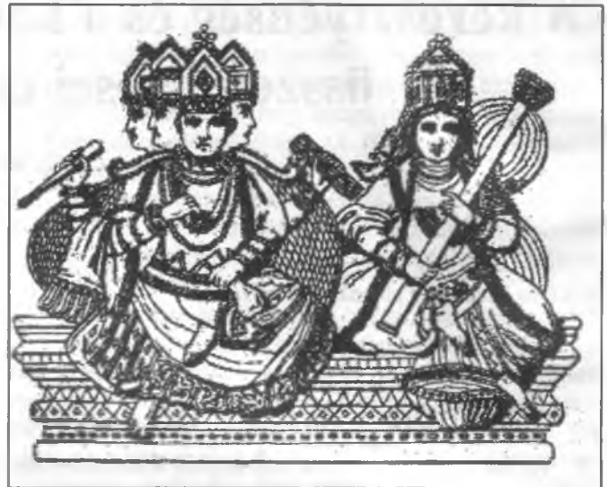
Brahma és Sarasvati. Tulajdonképpen az imádság, az istenekre ható szó, melyet e hitrege megsemélyesít. Brahmát négyarcúnak és négykezűnek ábrázolják. A négy arc azt jelenti, hogy mindenfelé ellát, a négy kéz azt, sokat, szinte mindent megtehet. Sarasvati a felesége, az ékesszólás és a tudomány istennője, akit négyarcúnak vagy szarvastehénnek is ábrázolnak

összezúz), de helyre is állít (bekötöz) és meggyógyít (Jób 5:18). Végül, de nem utolsó szempontból esik szó Izráel helyreállításáról: „Jöjjetek, térjünk meg az Úrhoz, mert ő megsebez, de meg is gyógyít, megver, de be is kötöz bennünket” (Hós 6:1).