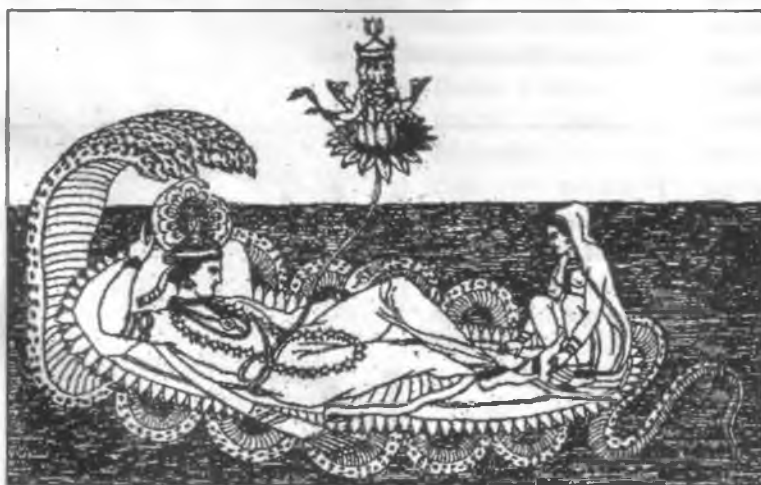
Brahma, Visnu és Laksmi. Visnu Ananta, a hétfejű kígyó testvére vetett virágszerű ágyon hever, nyakán csillagokból készült nyaklánc, a köldökéből kinyúló virágszáron nőtt virágok kelyhében a négyarcú Brahma. Visnu lábainál Laksmi, az urát gondozó feleség, a szépség és a szerencse istennője – a mitologikus képzetek szerint.

Először szólunk az árja vallás és a védikus korszak istenhitéről! Legősibb formája, amelynek emlékét a Rigvéda himnuszai (rics) őrizték meg, sokféle isten tiszteletéből állott, ezek az istenek túlnyomórészt természeti jelenségeket, pl. ég, föld, nap és hold, tűz stb. személyesítettek meg. Indra isten például, aki eredetileg, akárcsak az ősskandináv Thor, bizonyára viharisten volt, később mint a harciasság példaképe, az istenek királya jelentős szerepet játszott. A perzsa