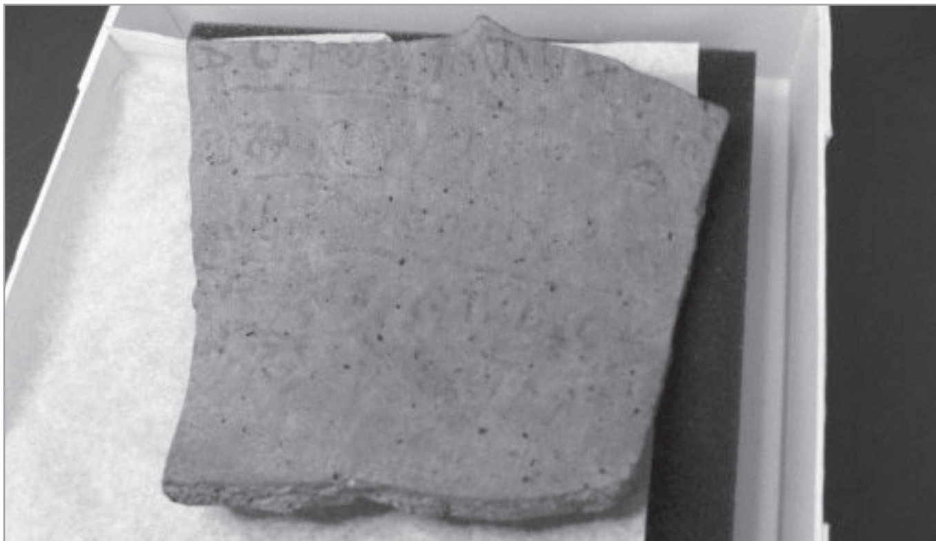
A „Gezer-kalendárium” néven ismert feliratos emlékre, mely egy 15x16,5 cm-es trapéz alakú cserépdarab, tintával írták az óhéber szöveget

Jeruzsálemben: „Most már joggal feltételezhetjük, hogy a Kr. e. 10. században, Dávid király uralkodása alatt, éltek olyan írnokok Izraelben, akik képesek lehettek irodalmi szövegek és más összetett történeti művek írására, olyanokéra, mint a Bírák vagy Sámuel könyve”. Galil azt is hozzáfűzte, hogy a szöveg komplexitása, valamint Elah masszív erődítményrendszere cáfolja azokat az elméleteket, amelyek szerint Izrael Királysága nem létezett ebben a korban.