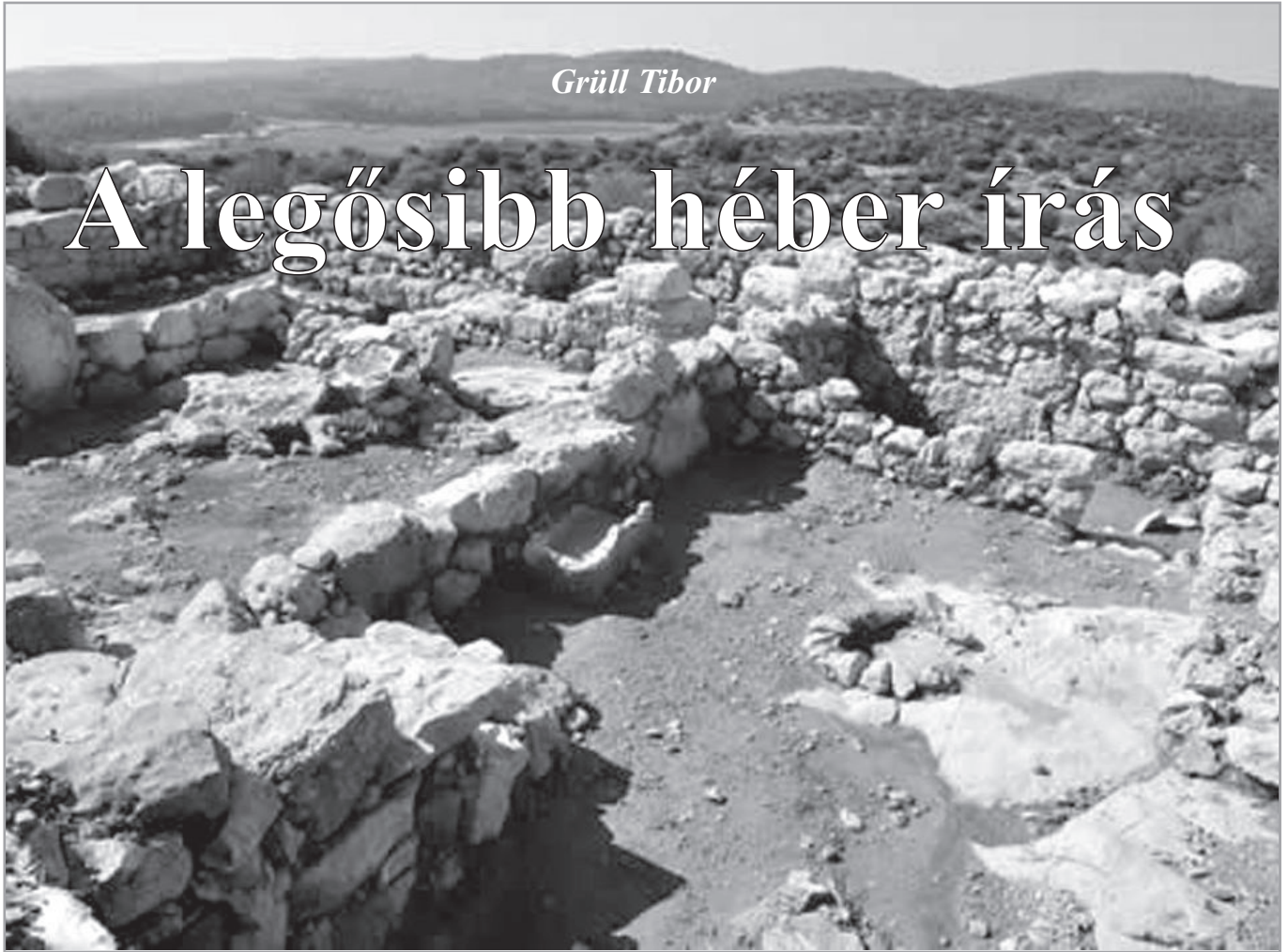
Elah-erőd (mai arab nevén Khirbet Qeiyafa), ahol megtalálták az érdekes osztrakont

Kánaánban és Szíriában valamikor a Kr. e. 2. évezred közepén létrejött hangjelölő (alfabetikus) írásrendszer valóságos információs forradalmat indított el az emberiség történetében. Ez az írásrendszer – valamennyi később született betűírás alapja –, amely a jelek számát 30-nál is kevesebbre redukálta, lehetővé tette az írásbeliség tömeges elterjedését, ezáltal a civilizáció rohamos fejlődését. Két fő típusa alakult ki Kánaánban: az ékjelekkel és a vonalas (lineáris) betűkkel írt írás. Ezeknek a következő altípusait találták meg a térségben (F. M. Cross felosztása szerint):