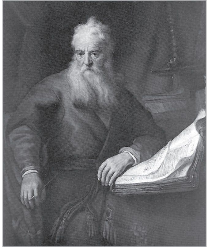
Rembrandt: Pál apostol (1635) (Kunsthistorisches Museum, Vienna)

A történet másik oldalát a 19. versben találjuk meg, ahol leírja, hogy a pásztor fel kell lépnie a tévtanítás ellen és azok ellen, akik megalkudnak és akadályozzák Isten szavának hirdetését.