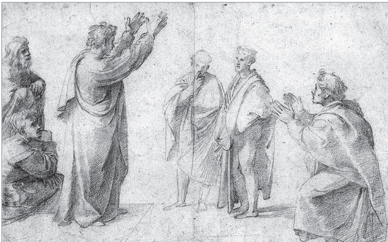
Raffaello: Tanulmány Pál athéni prédikációjához (1514–15) (Vörös kréta, 278 x 418 mm) Galleria degli Uffizi, Florence

Timóteus mikor prédikátorra szentelték, jövendölést kapott szolgálatát illetően. Természetes féltékenysége ellenére valaki úgy prófétált felőle, hogy ő bátor katonája lenne Krisztusnak. Mikor Timóteust szolgálatba állították, nagy dolgokat jövendöltek számára. Hasonlóan Gedeonhoz, akit Isten nem éppen arra hívott el, hogy bujdokolva gabonát csépeljen a családjá számára. Isten „nagy hősnek” nevezte őt. Gedeon