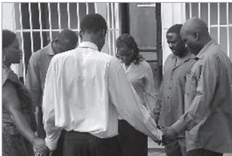
Az imádságban megtalálhatja egymást fiatal és idős lelképásztor. Ugandai pásztorok találkozója 2010-ben Kampalában

15. Hallottuk azt is, hogy Troászból olyan hosszú meghirdetéseket tartott, hogy egy prédikáció végighallgatása huszonnégy óras figyelmet igényelt, és mindez olyan kimerítő volt, hogy egy alkalommal egy fiatal férfi elaludt, és komolyan megsérült. Ne döbbenjünk meg azon, hogy azt állítja, újraélesztette, vagy inkább feltámasztotta az ifjút a halálból? Micsoda badarság! Nekiünk higgadnak és gyakorlatiasnak kell lenniük az egyházban, nem pedig felfokozott érzelmi állapotúnak! Azt a tanácsot szeretnénk adni önnek, hogy rövidítse le a prédikációit! A tapasztalat szerint a leghosszabb prédikációk esetében is csupán mintegy húsz percig tudja a prédikátor fenn-