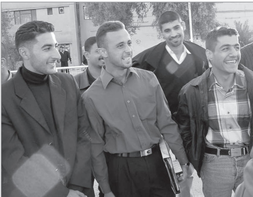
Fiatal pásztorok a közép-keleti térségből

pásztorokat kerestek, akik legalább harmincöt évesek, és rendelkeznek legalább tizenöt év tapasztalattal! Úgy látszik, az egyházban senki nem ért a matematikához! A tizenöt éves tapasztalathoz a lelkésznek húszévesen kellett volna hivatalát elkezdenie, de ez eleve nem lehetséges, mivel senki nem akar olyan pásztor, aki harmincöt évesnél fiatalabb. Hogyan működik ez? A hirdetésekben annak kellett volna állnia, hogy a lelkész nem lehet fiatalabb, mint ötvenéves, és legalább tizenöt éves tapasztalattal kell rendelkeznie. Timóteusnak nem