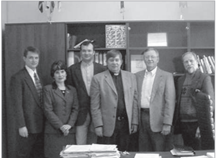
LCMS (Eurázsia) oroszországi területi missziói vezetők találkozása

semmilyen intézkedés. Szóval egyszer csak eljutottam odáig, hogy felálltam, és elmondtam a véleményemet, vagy intézkedtem a megoldásról. Sokszor éreztem úgy magam, mint egy fegyverhordozó, aki felugrik a tábornoka lovára, hogy vezesse az ellentámadást, mert a megbízott vezetők éppen versengenek, vitatkoznak vagy szundikálnak, miközben már látni az ellenséget a környező dombok tetején. Na igen, az ilyen döntések nem túl népszerűek ezekben a pillanatokban, de ilyenkor is tudnunk kell betölteni a küldetésünket!