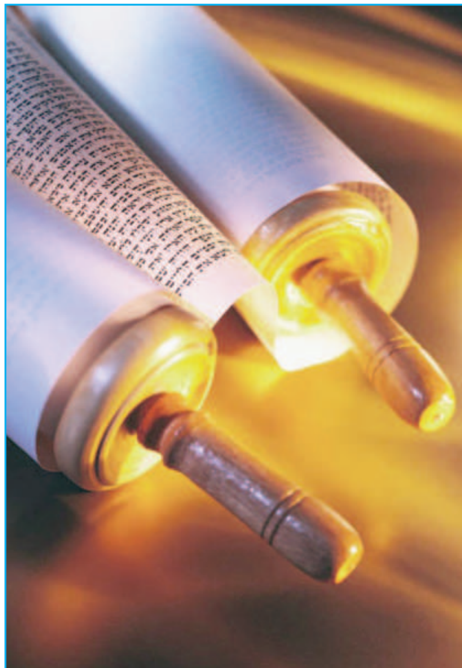
Izrael számára az Isten akarata megismerésének elsődleges forrása a kinyilatkoztatott ige volt

vetett hittől. Az Úr Izrael fiai számára egészen más lehetőséget ajánl fel, hogy megismerhessék az ő akaratát.