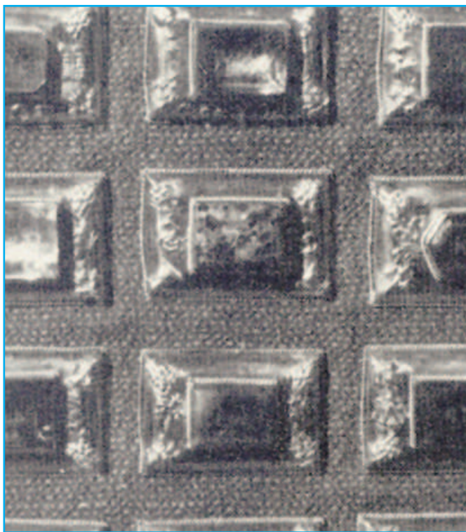
Az urim és tummim a szent tárgyak kategóriájába sorolandók, melyek a főpap palástjának kellékei voltak. A pontos működésükre a mai napig nem derült fény. A főpapi ruhának a másán látjuk a tizenkét követ, melyek Izrael törzseit jelképezik. Ennek segítségével hoztak – többnyire a szent dolgokkal kapcsolatos – fontos döntéseket, mint például az Ezs 2,63-ban is olvasható

„Akkor ezt mondta Saul az Úrnak, Izrael Istenének: Tárd fel az igazságot! És a sors Jónátánra meg Saulra esett, a nép pedig megszabadult. Saul ezt mondta: Vessetek sorsot köztem és Jónátán fiam között! És a sors Jónátánra esett.” (1Sám 14,41–42)