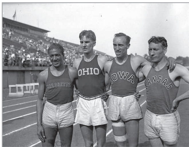
Glenn Cunningham a jobb oldalon áll

felhúzta magát a lécekhez, centiméterről centiméterre végig-araszolt a farács mentén, és egyfolytában arra gondolt, hogy egy nap jární fog. Ezután nap nap után gyakorolt, lassanként kikoptatta a gyepet a kertben a kerítés körül. Mindennél jobban vágyott arra, hogy a lábába visszaköltözzön az élet. A napi masszázs, a fiú vasakarata meg a szüntelen gyakorlás végül meghozta az eredményt, újra fel tudott állni, aztán támaszkodva, később segítséggel, majd segítség nélkül jární, majd futni. Újra iskolába járt, egy idő után futva, a futás pusztá öröméért. Az egyetemen bekerült az atlétikai csapatba, aztán elérkezett a nap, mikor az egykor halálra ítélt gyerek, akiről azt hitték, hogy soha nem tud majd jární, nem is reménykedett abban, hogy egyszer futhat, ez az elszánt fiatal ember, dr. Glenn Cunningham a Madison Square Gardenen felállította az egy-mérföldes futás világcúcsát, és kétszer megdöntötte, 1934-ben állította fel a csúcst.”