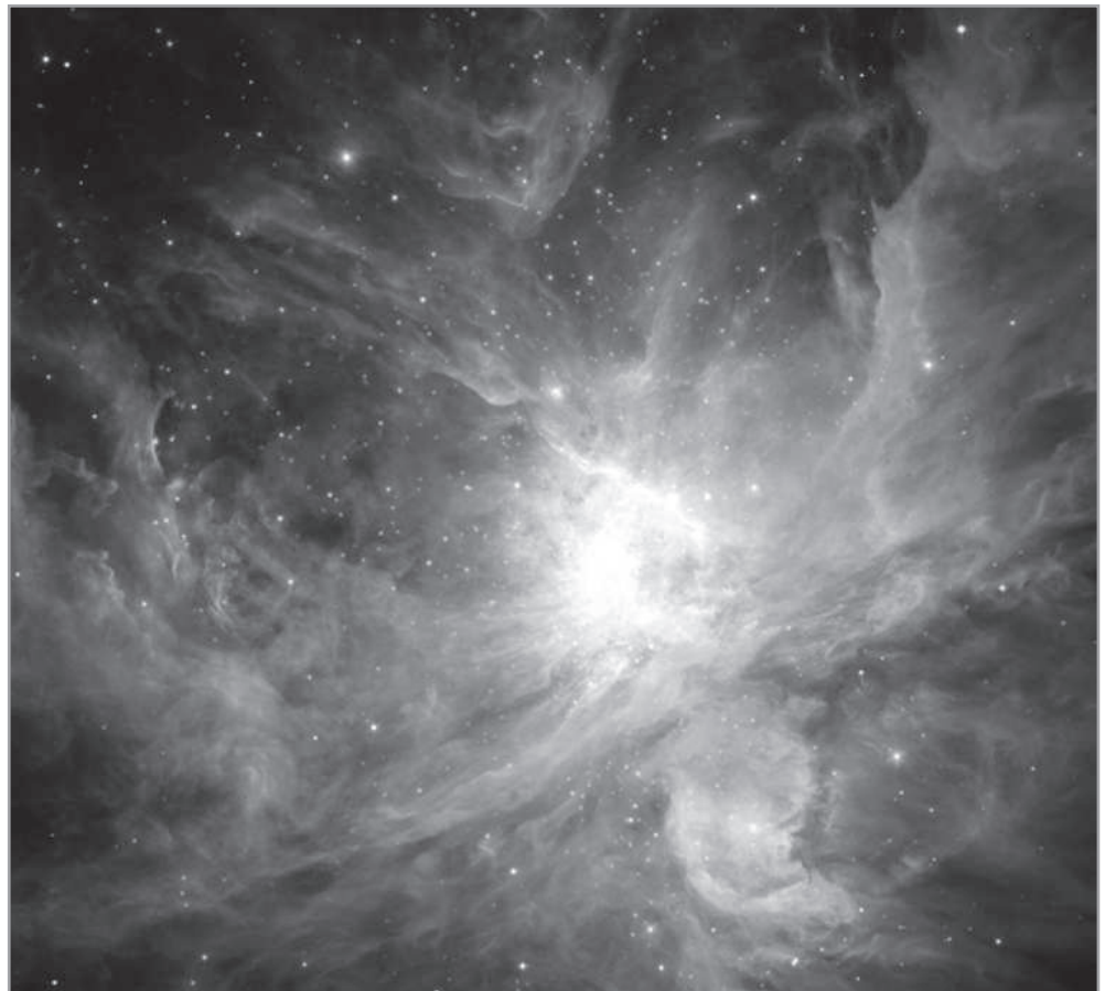
Az Orion-köd. A gázt az itt születő fiatal csillagok gerjesztik

Egészen gyakorlati módon ír a mennyről. Ézs 65. fejezetében azt mondja, hogy nemcsak hogy valóságos hely, de ott is „testben” fogunk élni, és zajlani fog az élet. Lesznek események, lesznek feladatok, tehát – legalábbis részben – a mi emberi fogalmaink szerint érthető, élhető világ az, és nem egy teljességgel felfoghatatlan dolog. Így szól erről Isten ígérete: „Mert ímé, új egeket és új földet teremtek, és a régiéket ingyen sem említetnek, még csak észbe sem jutnak; Hanem örüljetekek és örvendjetekek azoknak mindörökké...” (Ézs 65,17–18) Milyen érdekes kifejezés: nem örülni fognak, hanem maguk lesznek az öröm. „És vigadok Jeruzsálem fölött, és örvendek népem fölött, és nem hallatszik abban többé siralomnak szava, és nem lesz ott többé néhány napot élt gyermek, sem vénember, aki napjait be nem töltötte. Házakat építenek, és bennük laknak és szőlőket plántálnak, és eszik azok gyümölcsét, és nem úgy építenek, hogy más lakjék benne, nem úgy plántálnak, hogy más egye a gyümölcsöt, mert mint a fáké, olyan hosszú lesz népem élete, és kezeik munkáját elhasználják választottaim. Nem fáradnak hiába, nem nemzenek a korai halálnak, mivel az Úrnak áldottainak magva ők, és ivadékaik velük megmaradnak. És mielőtt kiáltanának én már felelek, ők még beszélnek és én már meghallgattam. A farkas és a bárány együtt legelnek, az oroszlán, mint az ökör szalmát eszik, és a kígyónak por lesz az ő kenyeré, nem ártanak és nem pusztítanak sehol szentségemnek hegyén, így szól az Úr.” (Ézs