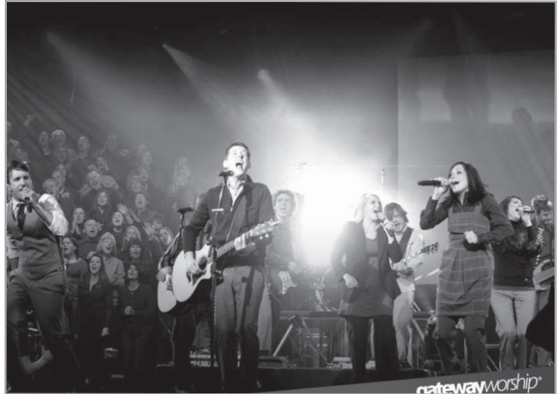
Keresztyén koncert. A jelenlevők tömegeit megmozgató zene, melyet szólista és a kórus kíséretével adnak elők

stb. Ha ezeknek az egymással összefüggésben lévő dolgoknak az arányai megváltoznak, kibillenünk az egyensúlyból. Ha túlzott a közösségi nyomás, a személyiség torzul. Ha túl sok az egyénieskedés, a közösség gyakorlása válik lehetetlenné vagy feszültté.