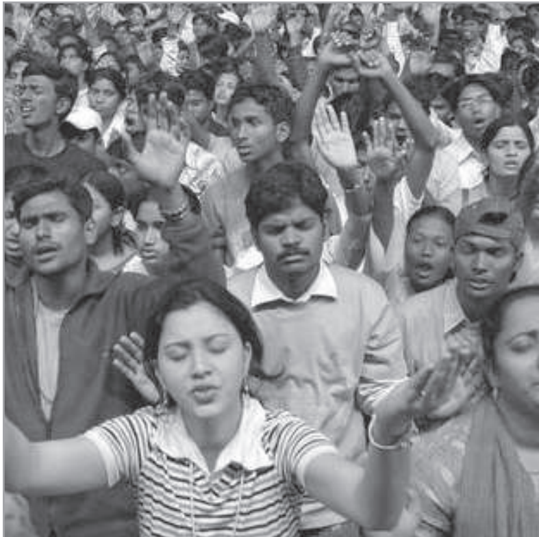
Némely esetben a közösség sajátos tanításának és kegyességi gyakorlatának kritikátlan és tömegnyomás alatti átvétele a szokásos belépő, amit akár „megtérés-ként” is lehet értelmezni

Az új tagokat toborzó technikákkal szerzik. Azért nem ezzel kezdtem, mert mire valaki feleszmélne, már kialakul egyfajta kötődés. Sok esetben