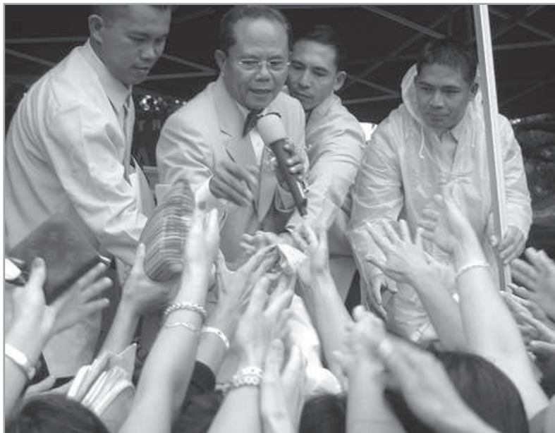
Rajongó megnyilvánulások vallási vezetők iránt a Fülöp-szigeteken

eleinte nem is adnak világos képet sem a szervezetről, sem a „megtérés” céljáról. Az érdeklődők nincsenek tisztában azzal, hogy mibe is keverednek. Sokszor a célcsoportok a hátizsákos fiatalok, mert éppen nincsenek a megszokott környezetükben, napi tennivalóik védelme alatt. A csoportban – főleg a kezdők esetében – a kétkedő vagy ellentétes vélemények negatív