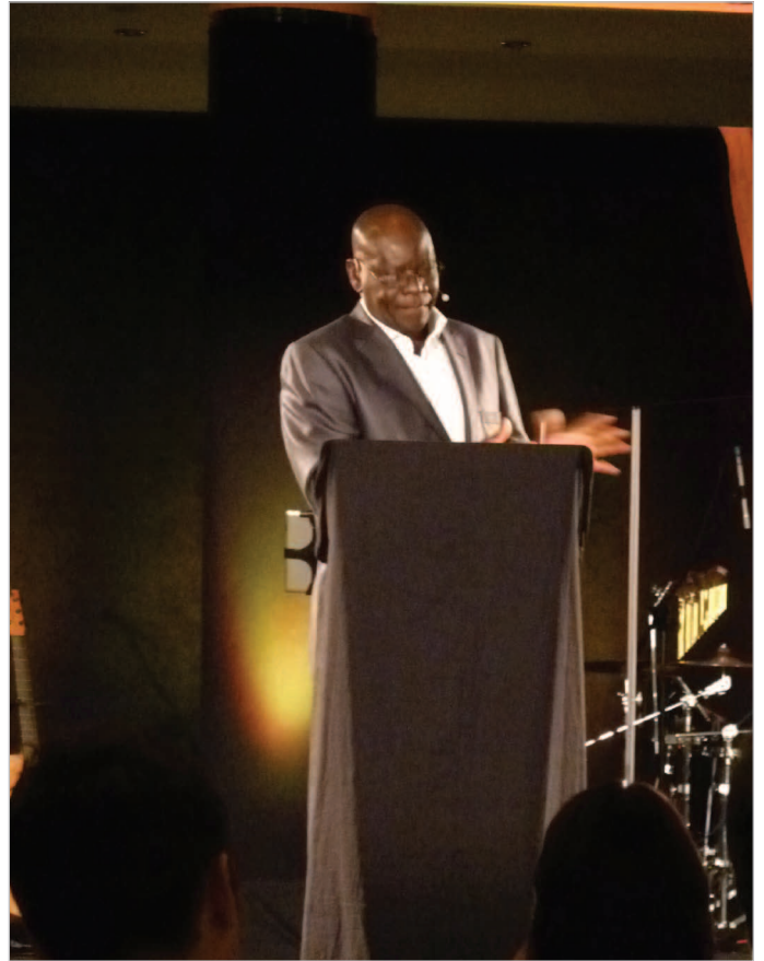
Peter Akinola, a Nigériai Anglikán Egyház vezetője