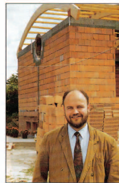
A Baptista Szeretetszolgálat nemcsak baptistákön kíván segíteni, hanem elsősorban a rászorulókon, ezért függetlenül az esetleges

Gyülekezeti jegyzőkönyvek, korabeli feljegyzések számolnak be arról, hogy a baptisták már a század elején támogatták a környezetükben élő szegényeket, az utcán esztangoló rongyos gyermekeket, és számukra testi és lelki segítyt nyújtottak. 1905-ben látva a nagy inséget, szeretetházat alapítottak Kiskörösn, később Hajdúbószorményben. Budán az árvaházban rászoruló gyermekekről gondoskodtak. A szeretetházi munka tovább folyik a két, időseket gondozó intézményben a szeretetszolgálati szaktitkár vezetésével. A Baptista Szeretetszolgálat alapításával egyházunk a jótékonykodás egy más területén, a karitatív szolgálatban kíván továbbépíteni. A Baptista Szeretetszolgálat