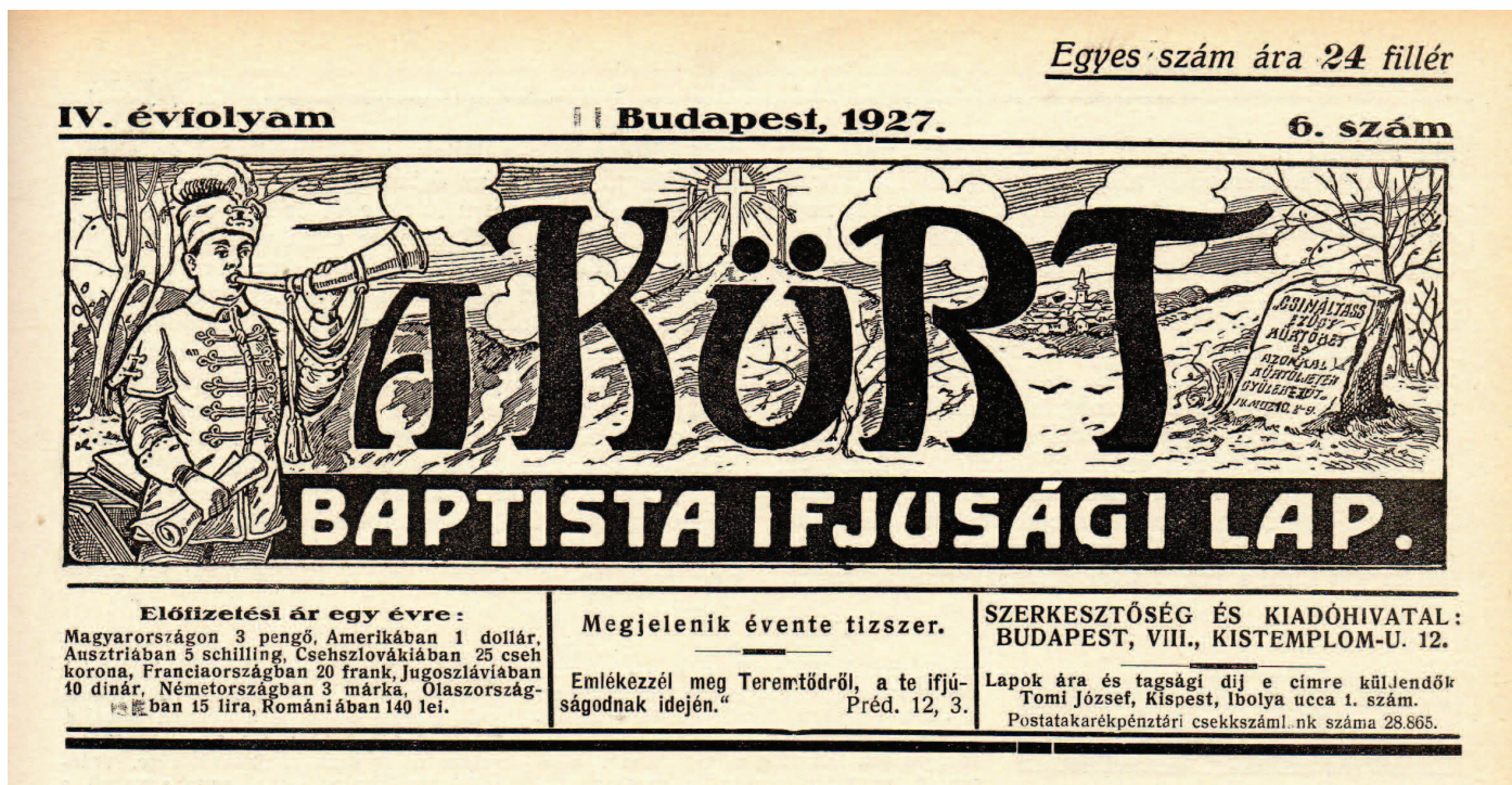
A Kürt (1927)

egy újság megjelenik, nemcsak a szerkesztő, vagy a tördelő foglalkozik a szöveggel, hanem a lektor és a korrektor is. Ám a bevezetőben emlegetett sajtószabadságért küzdők a cenzúra ellen küzdöttek. Olyan hatalmasságok ellen, akik saját szempontjuk szerint engedélyezték vagy tiltották a lapok megjelenését. A mai egyházi újságok szabadok, de egy cenzoruk ma is van: ez pedig az Isten igéje. Minden olyan írás megjelenhet, ami a Biblia tanításának nem mond ellent sem teológiai szempontból, sem pedig lelkületében, stílusában.