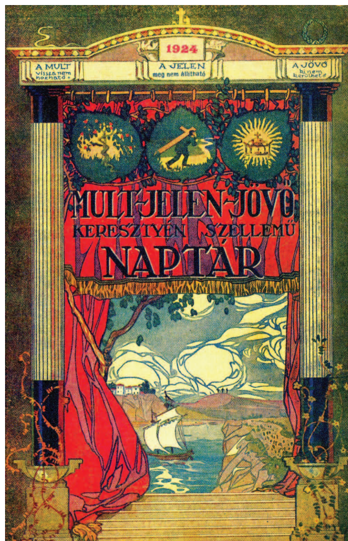
Múlt, jelen, jövő (1924)