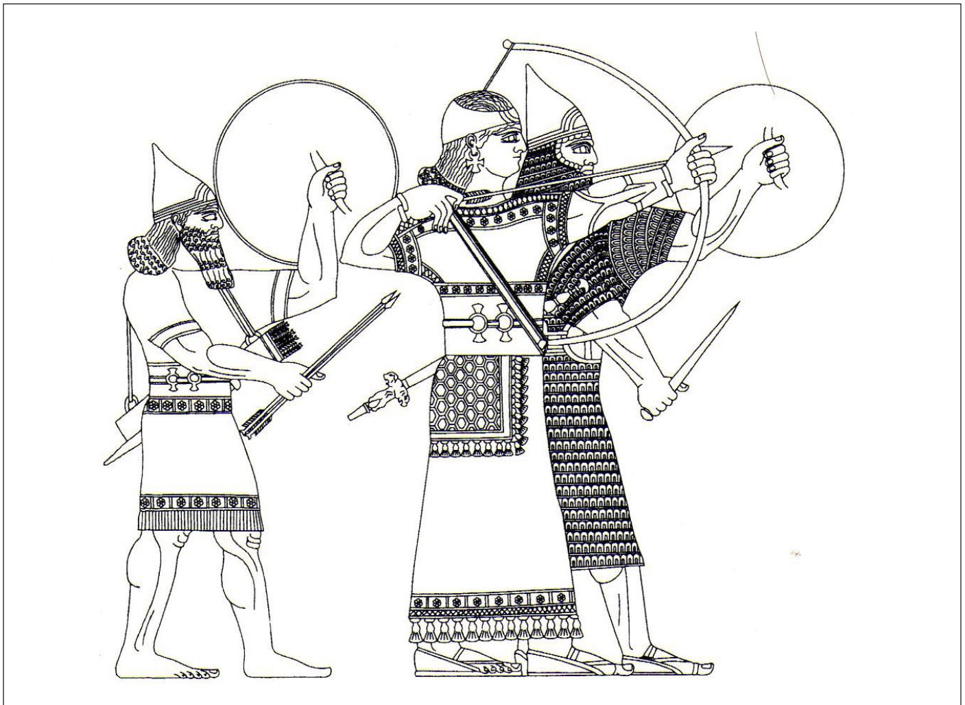
A szakáll nélküli rab ša-rēšē valószínűsített ábrázolása (középen) (Forrás: Dezső, 2012a, 323. o. 125. ábra)

A rab šaqē katonai szerepe mindenképpen meghatározó a tekintetben is, hogy saját katonai egységét az északi haderő parancsnokaként maga irányította és a birodalmi méretű katonai műveletekhez bármikor könnyen involválható volt. 45 Így az expanziós törekvések és a birodalmi egység kialakításában fontos szerepet játszott.