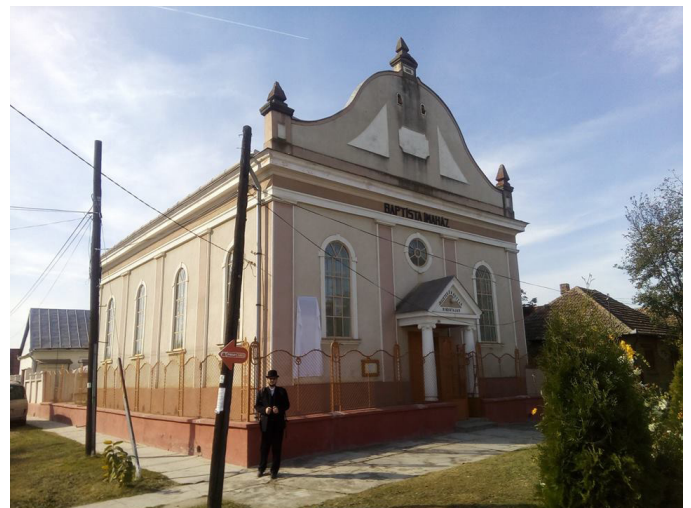
A bihardiószegi imaház épülete