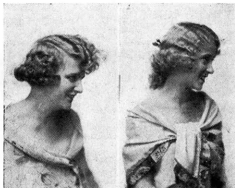
Rövid hajból és hajpótlékból