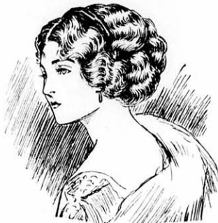
Fantázia rövid hajból