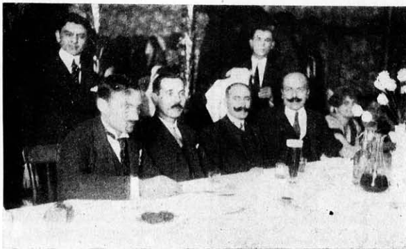
A szegedi vezetőség.

III. Papp Mihály: 1 borotvát (Dankovszky István ajándéka).