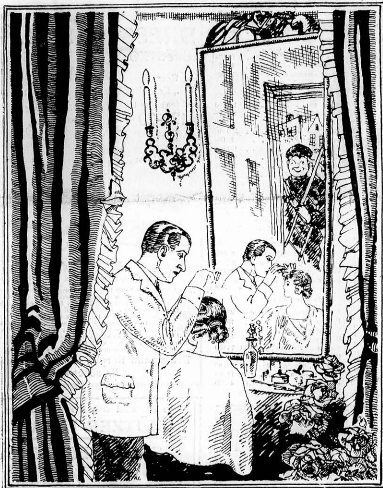
A „Fodrászipar” részére rajzolta Karvaly Imre Leó.