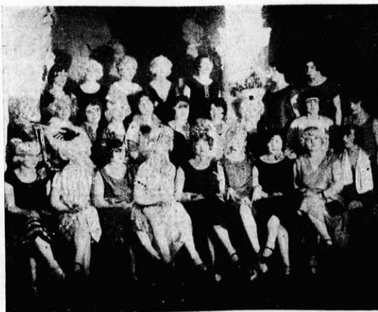
A december 13-iki versenyfésülés modelljei.

Ez a versenyfésülés nemcsak azért volt nevezetes, hogy megcsodáltuk a kiváló tehetségek munkáját, hanem ezzel a demonstrálással mintegy el- dőntötték az idei báliszezon frizu- radivatjának a sorsát is.