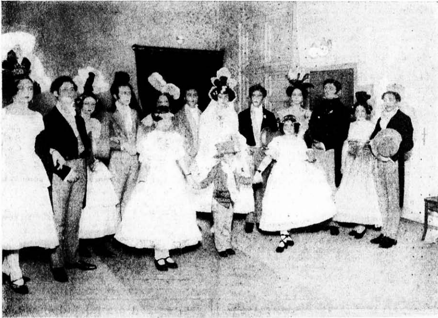
A wieni ünnepségen kreálta Otlmár Schüf.