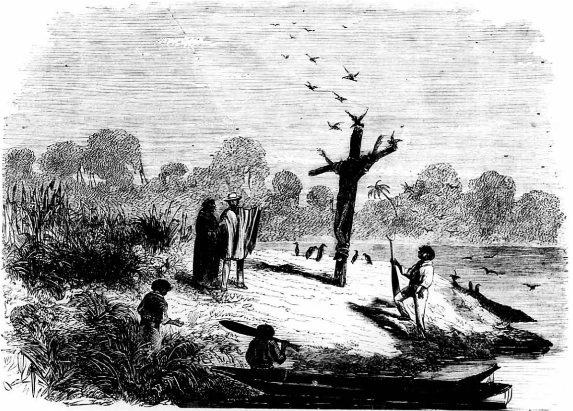
A megfeszített emberevő Ucayali szigetén. (Périban.)

Midőn ezen pont mellett elsurrantak, egy nádas homok-szigeten valami különös alakú tárgyat pillantottak meg, melynek körrajza élesen vált el az ég azurkékségétől. Ezen jelenséget frater Antonio szeszélyesen nőtt fatörzsnek állította, de ezt nem igen hívé el Marcoy s azért a szigethez eveztetett,