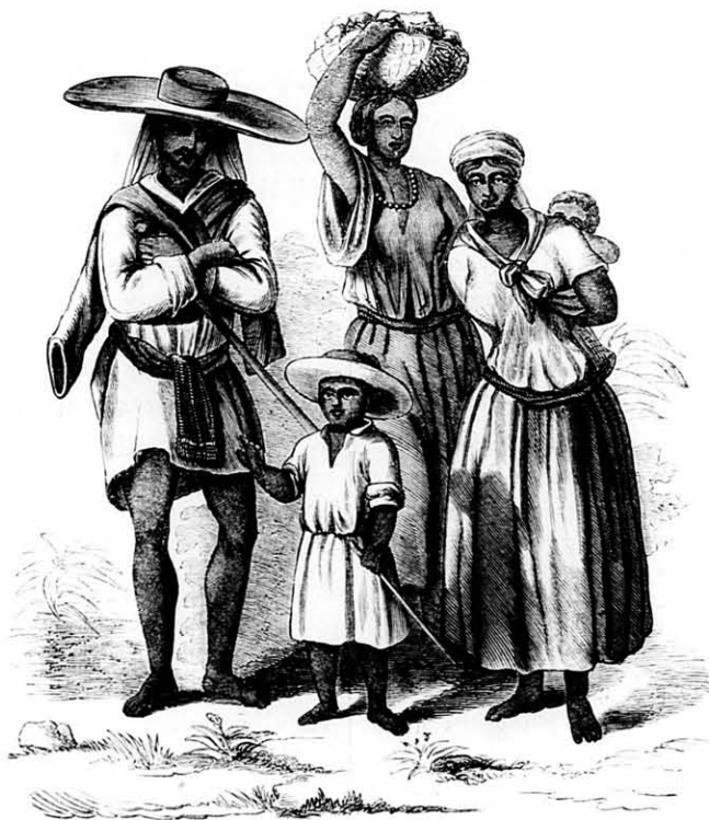
Panama-vidéki népviselet. (Eredeti után fára rajz. Haske.)

dett, az ut kivételé-vel, mely Panamából a déli államokba ve-zet. A folyó ottan, a hol az ut átszeli, mint-egy 10 öl széles, s alig ér térdig. Jobbra azonban nagy távol-ságra mélyebb, oly mély, hogy fenekét érni nem lehet, s it-ten történt, hogy rö-gtön levetkezve, egy-másután beleugráltunk s uszkáltunk a hideg folyóban, — mely közbevetőleg mondva, 27° Reau-mur meleg volt e na-pon, egy februári na-pon, noha azt mond-ják, hogy júliusban, midőn a Cordillerák hava olvad, a fo-lyó vize sokkal hi-degebb.