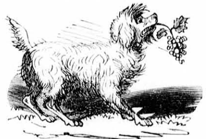
(Megfejtése a 48-dik számban lesz.)

A 46-dik számban közölt talány értelme ez: „Kevés sulya van a fegyvernek odakünn, ha nincs bölcsesség otthon.”