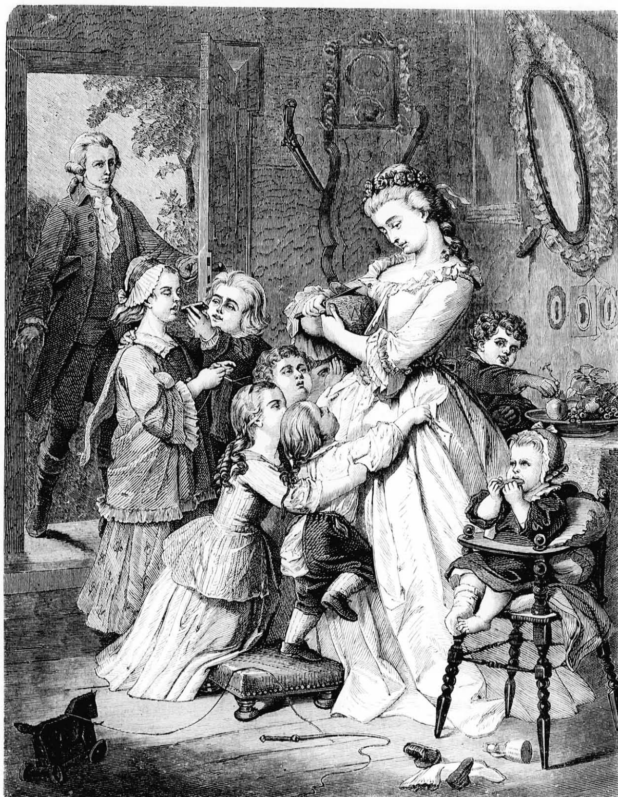
A boldog családi kör. (Szövege a „Vegyes közt.”)

Hogy a most mondottakra világosító példával