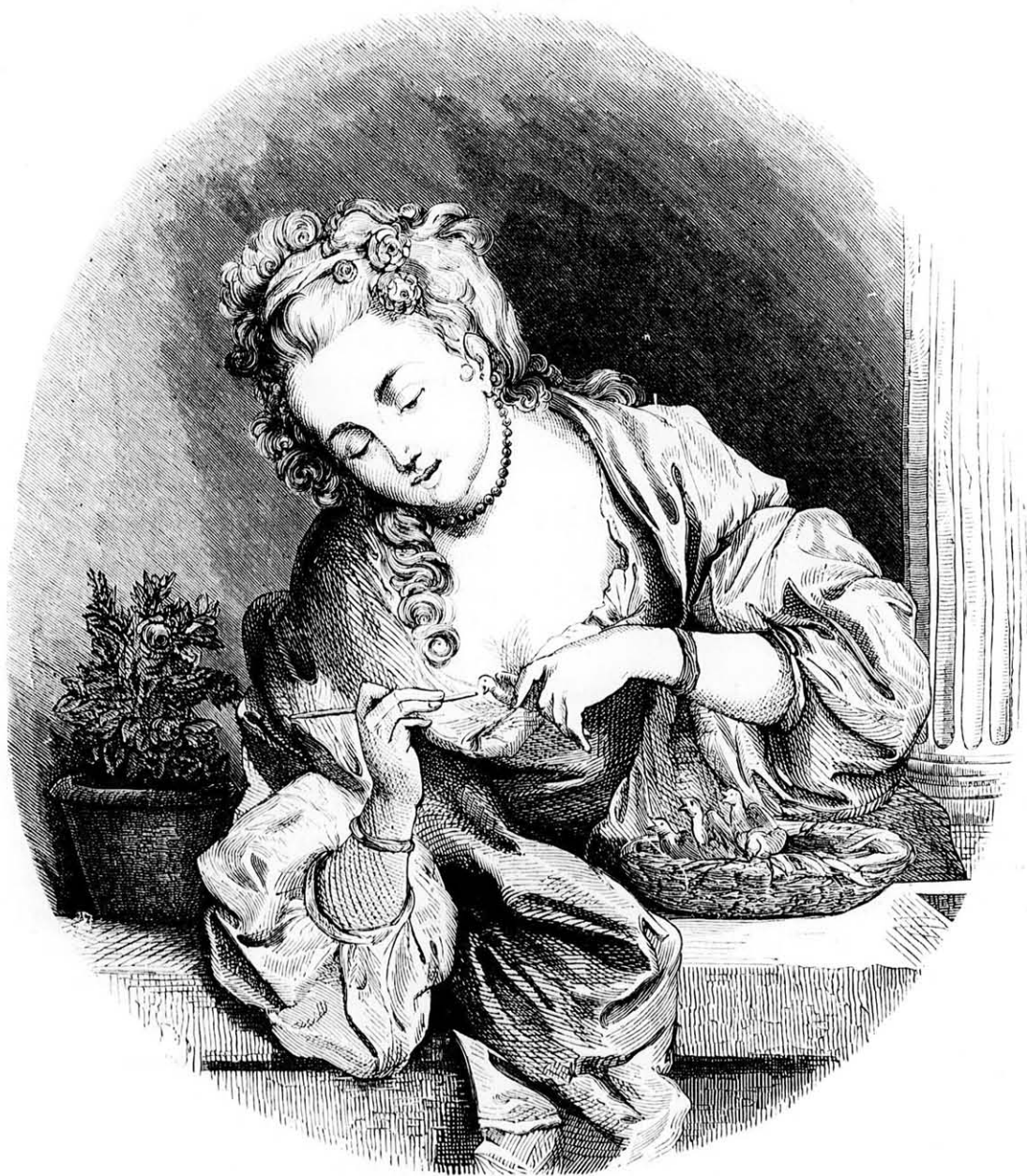
A gyöngéd ápolónő. (Szövege a „Vegyesek“ közt.)

gőzölgő, fehérre festett kétemeletes uszó ház sehogyszem teszi ránk azon benyomást, mintha az gőzös volna, de szemünk lassanként hozzá szokik. Sebessége ezen hajóknak igen nagy; vannak, melyek — mint mondják — 24 amerikai mértföldet tesznek egy-egy órában. mi körülbelül \frac{1}{3} rész sebességgel haladná meg a mi pompás nagy dunai hajóinkat; azaz oly utat, melyet a dunai gőzösök 3 óra alatt tesznek, az amerikai 2 óra