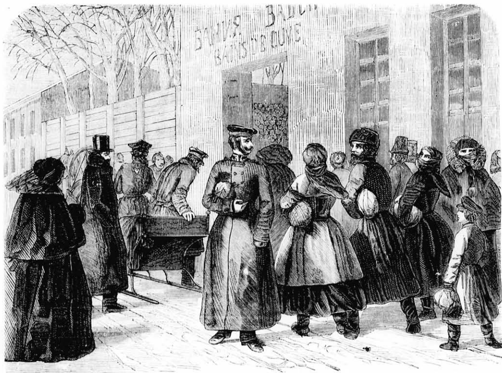
Tolongság egy sz. pücteryári orosz gőzfürdőbe. (Szövege a „Vegyes“ közt.)

Az orvostól nagyon félnek a bunyevácok, s csak végső esetben veszik igénybe segítségét; ha betegök van, öreg asszonyt hívnak, ki a beteg felett imázik s mindenféle füvekből főtt kotyvadékat ad a betegnek, melynek csak ízétől is megbetegszik az