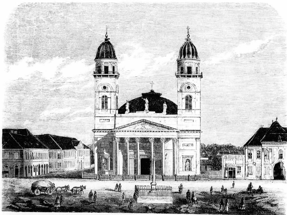
A szathmári székestemplom. (Fénykép után.)

A Niagaráról írni nehéz dolog. A természet itt egész magasztosságában tűnik fel, s a látvány nagyszerűségét s gyönyörét sem eset, sem toll, még a legmesteriobb kézben sem bírja megközeli-tőleg sem visszaadni, — már csak azért sem, mert azt a méltóságteljes tompa mély zugást-morajt, azt az örökké változó mozgást, a zuhatag utánozhatlan smaragd-zöld színét, mely a tajtékzó fehérré zuzott habokkal keverve, másutt seholsem létező színezetet, színvegyületet s átmeneteket ké-pez, a legsötétebb zöldből a hófehérig, senki sem