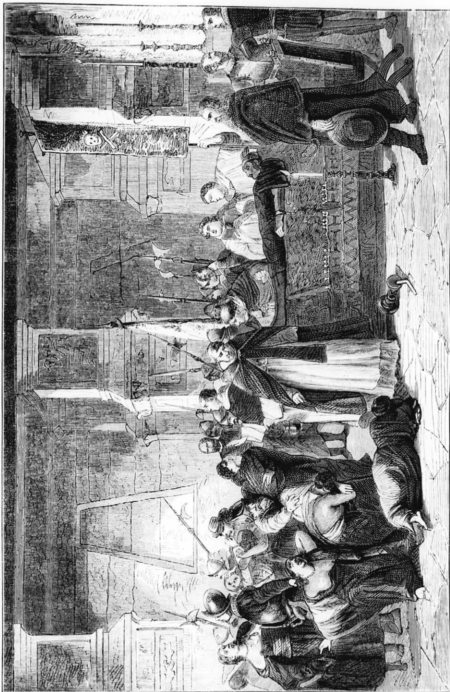
Atahualpa péru király temetése, Monteroiól. (Szövege a „Vegyes” közt.)