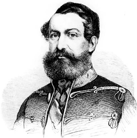
Gaál László honvéd tábornok.

hunytat a város közköltségén fényesen akarta eltemettetni, de az akkori időkből ez nem történhetett meg. Egyszerűn temették el, nehogy a gyászünnepélyben tüntetést lássanak.