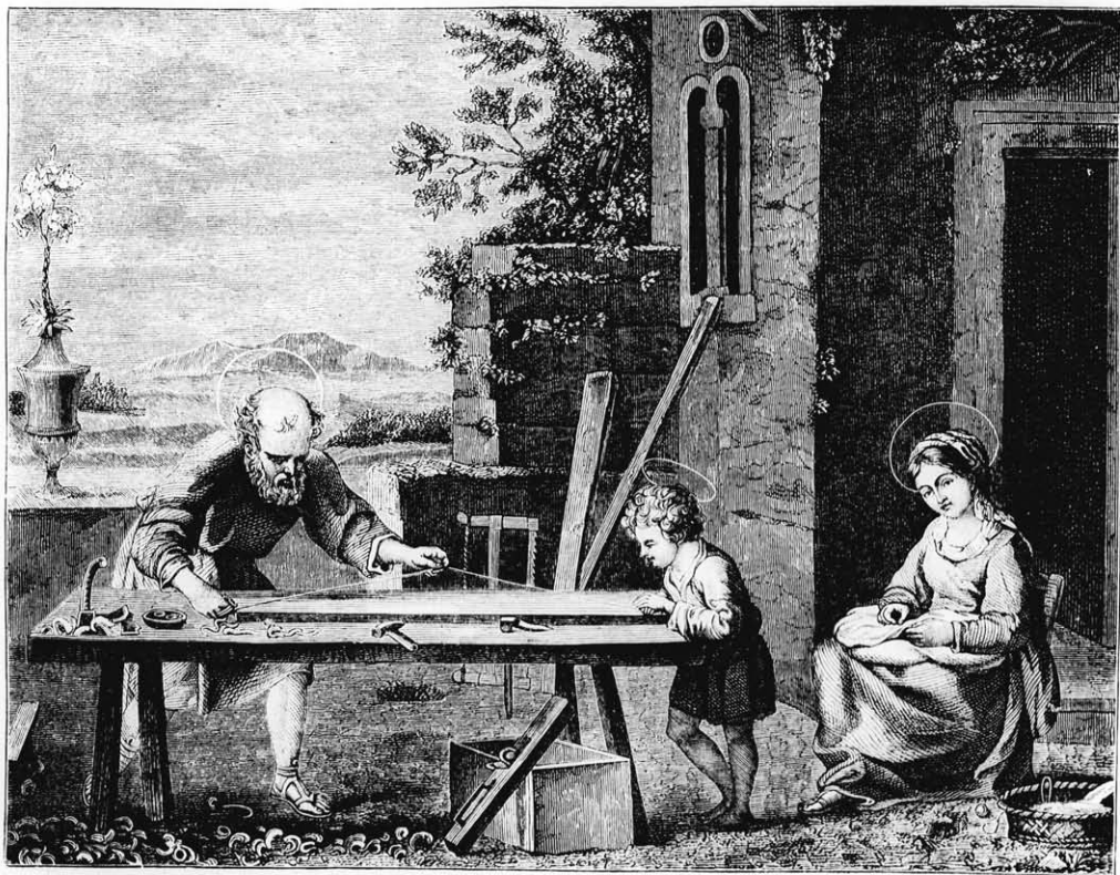
„A szent család, Caracci Hamiből. (Szövege a „Vegyes” közt.)

Én mindennel el vagyok látva, mi paraszt gazdának szükséges. Mosolyognál, ha látád, mikép az egykori felsőlázi tag, politikus beszédek he-