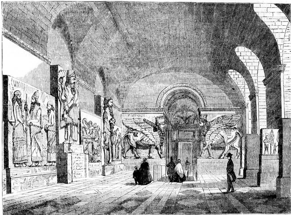
Az asszír muzeum nagy terme a párisi Louvrebán. („Ninivéről” című cikkünkhez.)