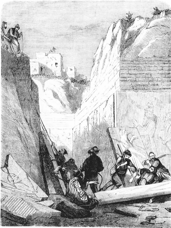
A khorzabádi ásások. („Ninivéröl” című cikkünkhez, a 467. oldalon.)

kas, kevély, sértő, vérig gúnyolódó, keményen és megvetőleg feddő, komoly dolgokban gyakran könnyelmű, kétes pillanatokban pedig — bő tanácsa dacára — ingadozó vala. Az urak mind igen félték tőle, mert a ki őt megbántotta, ha hirtelen föllobbanó haragja tüzet ki bírta is állni, maró gúnyjától tönkreveretett, s az övéhez hasonló elmével egyikük sem birt, hogy vissza