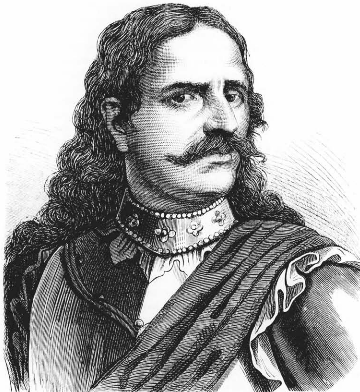
Gróf Bercsényi Miklós, II. Rákóczy Ferenc főhadvezére.

Mindent, a mi Rákóczy ellen vagy a német mellett volt, kibékíthetlenül gyűlölt. Indulatának egyes hevesb kitérései is ez alapérzelmére vezethetők vissza. Így például, mikor a turóci követek által méltatlanul gyanúsított fejedelem az