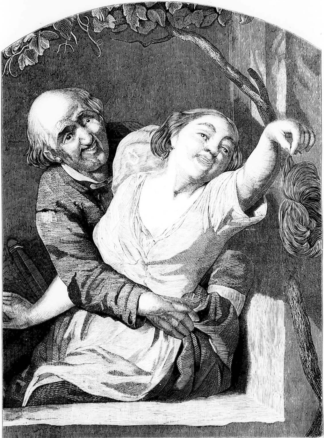
A vén szerelmes bünhődése.