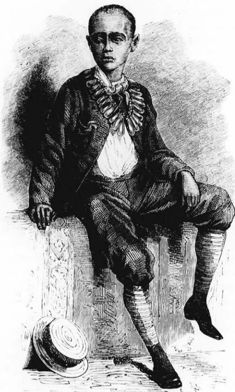
Theodorosz fia, Abissínia trónörököse.

zül sokan szerencséjüknek tartották, hogy hozzá szegődhettek.