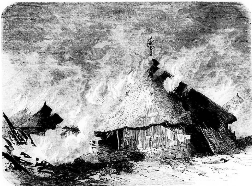
Magdala elézése. (Az „Egy fekete király foglyai“-hoz.)