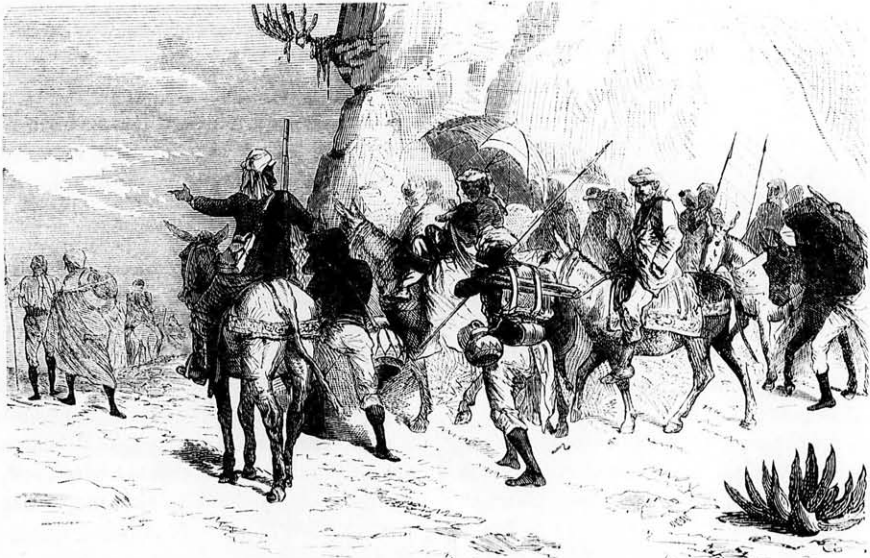
A megszabadult európai foglyok elindulása.

Kilencedikén jókor reggel tudunkra adta Theodorosz néhány európai munkása, miként a négusz ismét utat csináltat, hogy tűzéréségét Fahlá felé vihesse, mely falu a Bakhiló folyamvölgyén való átkelésen uralkodik. Theodorosz ugyancsak ismét mintegy száz benszüllött foglyot, jobbadán asszonyt és szegény férfiakat bocsátott szabadon. Ebéd után tudatta velünk a fejedelem, hogy számos hadi népet látott, mely a Dalmtáról