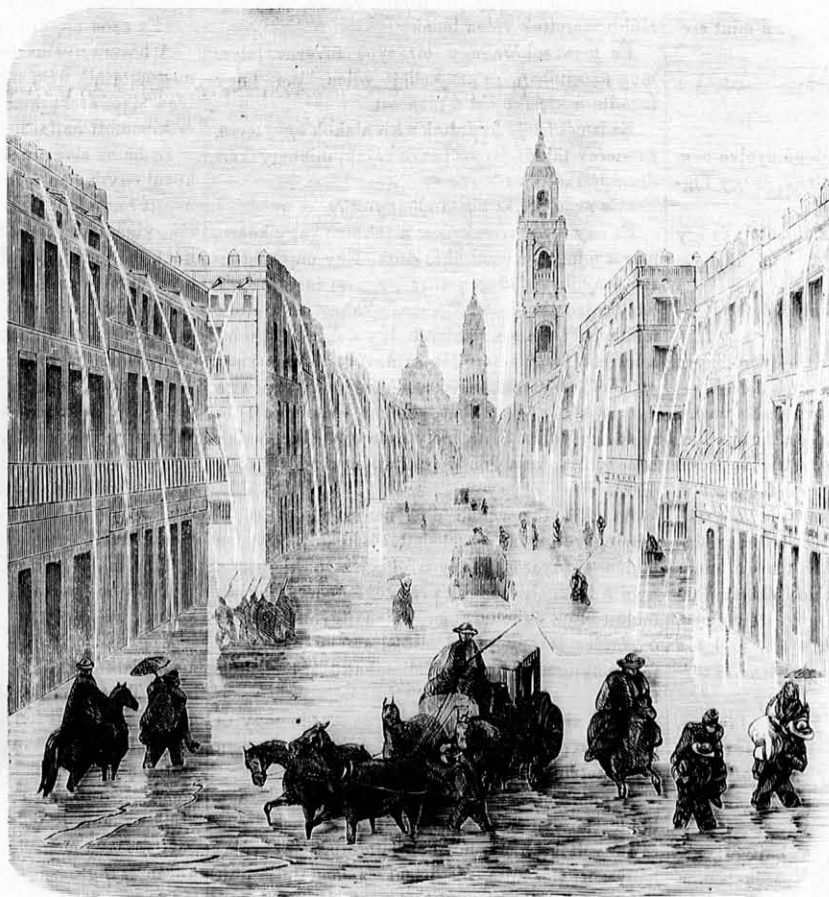
Egy mexikói utca az esős időkben.

Arria alakja fölülmulja magasztosságban kor-