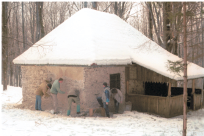
A „kárpátosoknak” köszönhetően a Les-ház után az Őr-kő ház is kívül-belül megszépül.

A Bükki Nemzeti Park Igazgatósága és az Egererdő Rt. segítségével tavaly kezdtünk hozzá a menedékházak megmentéséhez. Az elmúlt évben a Les-házat tettük rendbe, a közelmúltban a Bélapátfalvához közeli, fokozottan védett területen található Őr-kő ház felújítását vállaltuk az egyesület tagságával. A jövőben újabb pályázati forrásokat próbálunk kihasználni, hogy valamennyi ház használhatóvá váljék.