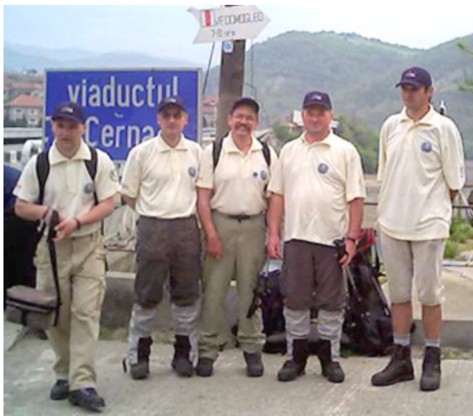
A gerinc-csapat indulásra készen, Orsova

A nemzetközi jelleg abból is adódik, hogy a Magyarországi Kárpát Egyesület mellett társszervezők is vannak: Romániából az Erdélyi Kárpát-Egyesület, Ukrajnából a Kárpátaljai Cserkész Szövetség és Szlovákiából a Kassai Kárpát Egyesület.