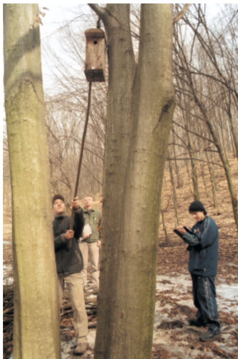
Az odútakarítás legfőbb műveletei: megtalálás, leemelés, tartalom vizsgálat, tisztítás, visszatétel, adminisztráció

Igazán dicséretes az aktivitásunk a környezetvédelem területén: a fiatalokkal kitisztítottuk a Berva-völgyi odútelepet és többen részt vettünk a már szokásosnak nevezhető béka-mentő akcióban is.