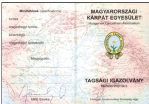
A kihajtott igazolvány külső oldala

Talán a kicsinyített fénymásolaton is látható, a tagsági kétnyelvű (magyar és angol). Célunk, minél több bel- és külföldi partnerszervezettel „elfogadtatni magunkat”, a kölcsönös kedvezmények biztosítása érdekében. Az egyeztetések elkezdődtek.