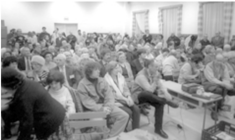
Az Áprily Lajos Középiskola dísztermében kb. 140 jó magyar ember volt kíváncsi a Kárpátok bérceit és a résztvevők erőfeszítéseit bemutató vetítésre