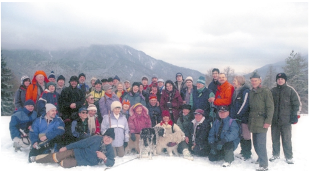
A szuperbuli után kellett a levezető túra. A brassói találkozó lelkes résztvevői a Bolnokra kirándultak