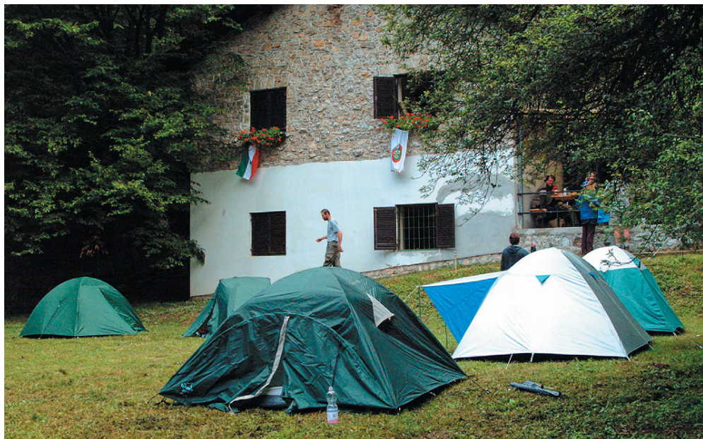
Sátoroztak akik nem fértek be a házba