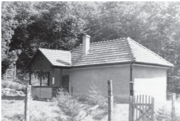
Peskó ház 1969 időtájt

A Peskó ház építési idejéről, körülményeiről ez idáig nincsenek adataim. A mesébe illő házikót először egy túrán – még középiskolás koromban, valamikor az 1960-as évek vége felé – a „csak hegymászóknak és csak száraz időben” feliratú helyen leereszkedve, a Peskó lápa után pillantottam meg. Akkor azonnal megkedveltem és nem is reméltem, hogy egyszer szabad bejárásom lesz oda. Most, 2005 szeptemberében kérdezem a legilletékesebbet, a vendégkönyv szerinti „Ösanyát”.