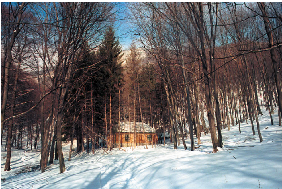
A télen még a ház fölé magasodó Pes-kő sziklája is látszik. Útvonal: Eger – Felsőtárkány (busz) – Varró ház – Hideg-kúti-völgy – Pes-kő-völgy a piros jelzésen. A gyalogos rész a házig kb. 8 km