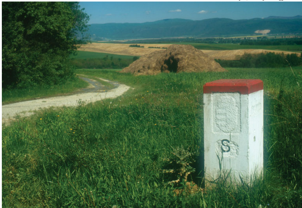
Egy újrahasznosított határkő