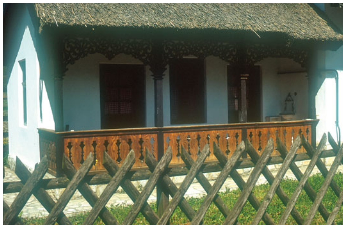
Tájház Gömörszőlősön, ahol Tompa Mihály könyvei is láthatóak