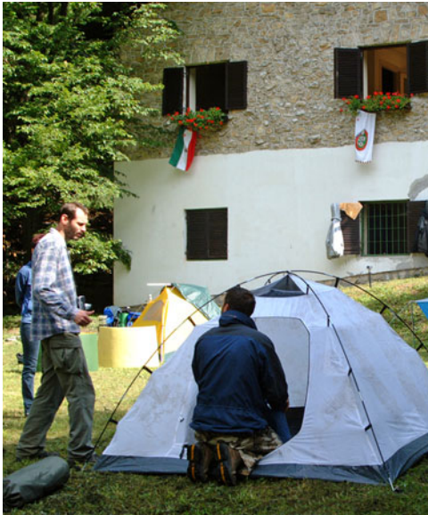
Sátorbontás a Tamás-kúti ház udvarán

A hivatalos munkatábor érdektelenség miatt elmaradt. Ellenben volt helyette egy kellemes kötetlen hétvége. Aki ott volt az igen jól érezte magát és még a munkában sem kellett meg-szakadnia. (2. oldal)