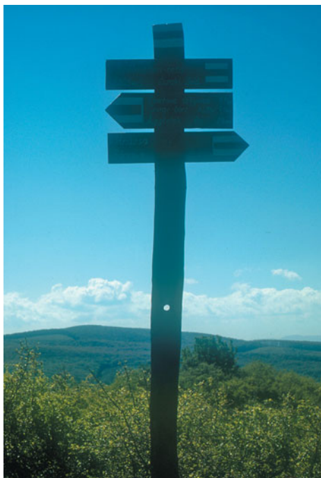
A segítőkészség „emlékoszlopa” a Szélmalom-tetőn

Több helyen a határsávban kis tuskók sokasága lapul a fa között. Csak akkor veszem észre, mikor már a bokámat forgatja. Egy teljesítménytúrát kiírni erre a részre, nagy kitolás lenne a futóbolondokkal. Teljesen biztos, hogy jó párnak kifordulna a bokája. Ezen a napon keveset haladtam előre. Visszaereszkedtem a Széki-pusztához. A kocsinál próbáltam megmosakodni, valami emberi formát ölteni. A főnök úr észrevett, szólt, hogy bent az irodájában melegvíz vár