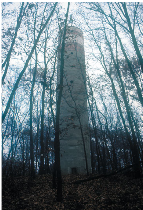
A Barátfői kilátó