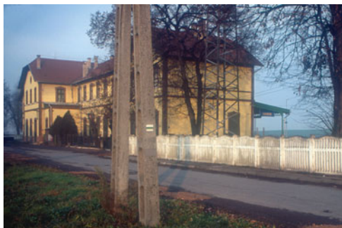
Indulás a Bánréve vasútállomásról

Bánréve vasútállomásáról reggel 8 órakor kezdem a vándorlást. Kiballagok a 26-os számú fő közlekedési útra és a jelzésen pár perc alatt, elhagyom a falut. Az utam a Sajó széles lapályán hatalmas nyárfákkal kísérvé vezet át Sajópüspökibe. A Sajópüspöki hídtól indul minden év utolsó hétvégéjén a Sajó vadvízi túra teljesen a Tiszáig. A templom majd a temető mellett elhaladva az enyhén emelkedő utam a Kis, és Nagy völgy főjébe, eléri az országhatárt. A füves háton a határ mellett, egy karón, útjelző tábla. Mutatja, hogy Pisszkorfő 3 km-re, és 1 óra járásra esik. Az útjelző póznából csak ez az egy, a táblás van meg, pedig a Kárpát Lapok hasábjain olvasva arról szerezhettem tudomást, hogy a jelzést festők, leg-