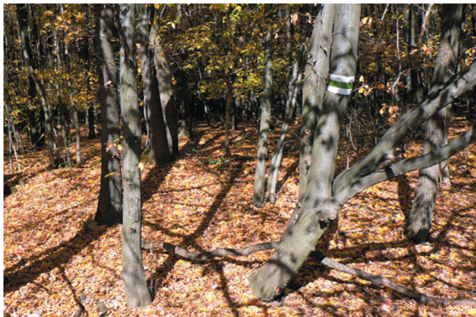
Egy hangulatos erdőrészlet...

erdei úton összezártuk Nógrádszakál felé. Útközben érett, vad ringlőszívát találtunk. Jól belaktunk a nyár első gyümölcséből. Már alig vártam, hogy a nyár ehető legyen. Ahogy észak felé végeztünk, megindultunk déli irányba. A munka gyorsan ment, hiszen most kocsival is jól járható terepen dolgoztunk. Várt ránk a huszonkettes főút. Könnyen, jól haladtunk Király-hegy és Leszürge-hegy felé. Az akácerdőket legelők váltották. Legelők szélén vadászlesek álltak. Festettünk élő fákra és a vadászok állásaira. Túljutva Leszürgén, erdő szélén lévő napra törekvő bozotos nem engedett vissza az erdőbe. A főút felé haladva, egyre rosszabbra minőségű földútra értünk. Visszafordulni, nagy kerülőt tenni nem akartam. Mély keréknyomok mentén, nagyon