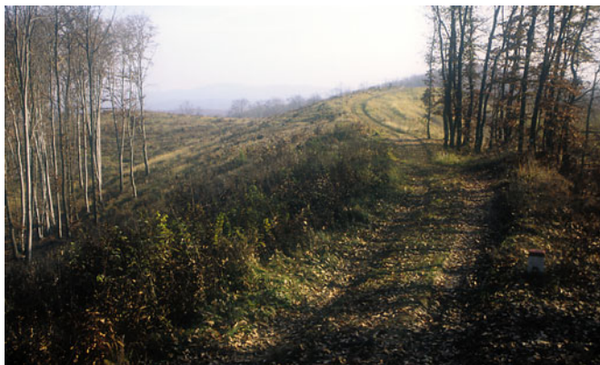
A tetőről időnként szép kilátás bontakozik

szinttartó orom, és sokkal jobban kitaposott út erősen hívogat Szlovákia felé, de nem engedek a csábításnak. Először a Domaháza mellett húzódó Felső-völgy baloldali gyeper tetejét járom végig, aztán az erdős jobb oldalit is. A szlovák oldalon a Macskás-patak felső szakasza mellett a csárdánál birkát legeltetnek. A ködfátyolból árnyszerűen bontakozik ki az Ajnácskői bazaltvidék hatalmas kúpja a Ragács (537 m). Domaháza felett több helyen is találni leégett erdei fenyveseket. Ezek a tavaszi zöld fű után sóvárgó birka pásztorok figyelmetlenségének tartós mementói. Domaháza felett az un. sarkon tábla nincs a fakitermelés, viszont folyik. Nem tudni, de lehet,