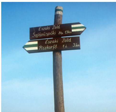
Ez az útjelző szerencsére megmaradt

Az Uraji-völgy legelős oldali felett a Susa sarkán, több gerincen átvágó valamikor gyakran használt több száz éves mélyutat is keresztezek. Ezek a régi, Trianon előtti idők eltörölhetetlen összetartozás, jeleiként maradtak ránk. Némelyik olyan mély, hogy bizony hatalmas várárkoknak is beillenek. Mogyorós orom előtt jól rá lehet látni a falura. Az egyik susai vadgesztenyefa alatt írta 1850 tavaszán Tompa Mihály a Gólyához, című versét. A környék méltán híres költője eme verse miatt kétszer is volt a kassai börtön vendége. Az