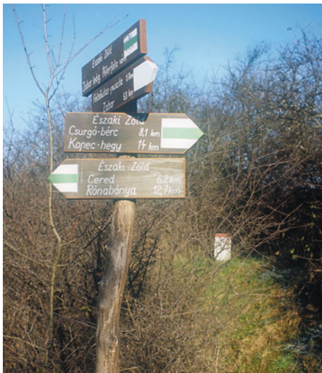
Merre tovább? Eligazít az útjelző

gyobb dolog, hogy az út fel van festve. Az útjelző táblák is a helyükön. Készíték a 342 m magas tényleges Kopec-tetőn „csúsfotót” A kissikatori Árpád-kori körtemplom a hegytetőn, sejtelmesen bontakozik ki a Hangony-völgy ködtengerből. A Kopec tetejének öreg bükkösében fehérhátú fakopáncs keresgél. Ez a Kárpátok egyik legritkább harkályféle madara, de ezen a környéken még szép számmal található. A Petykebércen IX 28 határcölöpnél a jel hirtelen balra fordul, bár a