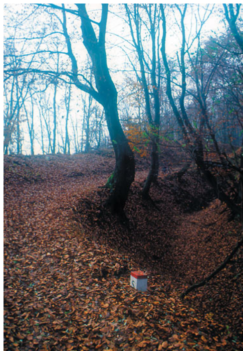
„Erdő kíséri utamat mind a két oldalon”

Uraji-patak forrásvidékén fekvő régi gömöri falu Susa, ma Ózd része. A Mogyorós ormon nem találok a Máji József által felszerelt táblákat. Kinek volt útjába az a deszka darab? Az oromról két oldalt több méter magas kőkény, és vadrózsa sövényfal kísér, mintha egy óriási vályúban haladnék legalább egy kilométeren át. No ez volt ám az igazi kerítés gondolom magamba, de biztosításként rozsdásodó drótháló maradványok is feltűnnek a szlovák oldalon. A kisebb nagyobb hullámba a nagyobb emelkedőket nélkülöző utam a szlovák oldalon a Jénei-tó felett meredekre vált, és extrazonális bükkösök tenyésznek rajta. Innét kezdve a szlovák oldal a Cseres-hegység Tájvédelmi körzet részét képezi teljesen a Zabar, és Gömörpéterfalva (Petrovce) közötti tetőig. Már dél is jócskán elmúlik mikor a Hangony melletti Tormák, legelős oldalainak gerincén, vascsövekre festett jelzéseket találok. No ezt szerencsére még nem bántották. Bár az ózdi megélhetési vasgyűjtők szenvedélyét figyelembe véve meddig fog itt állni?! Nem tudom. Bár ha idáig nem bántották! A Pogányvár régi őskori sáncait rejtőgető éles gerincein egyensúlyozva halad tovább az utam. Néhol tényleg olyan éles a gerinc, hogy éppen csak elfér rajta az ös-