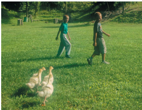
Ismerkedés a háziállatokkal