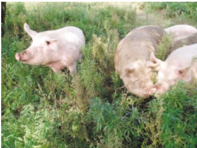
...ki korpa közé keveredik... (avagy biomalacok)