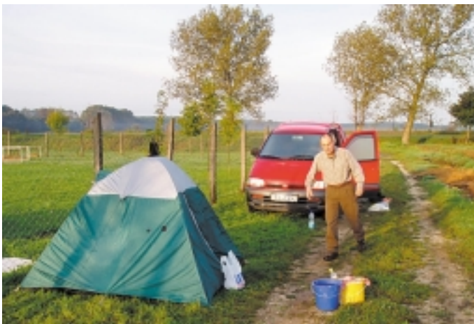
Szállásunk a Szügyi focipálya mellett