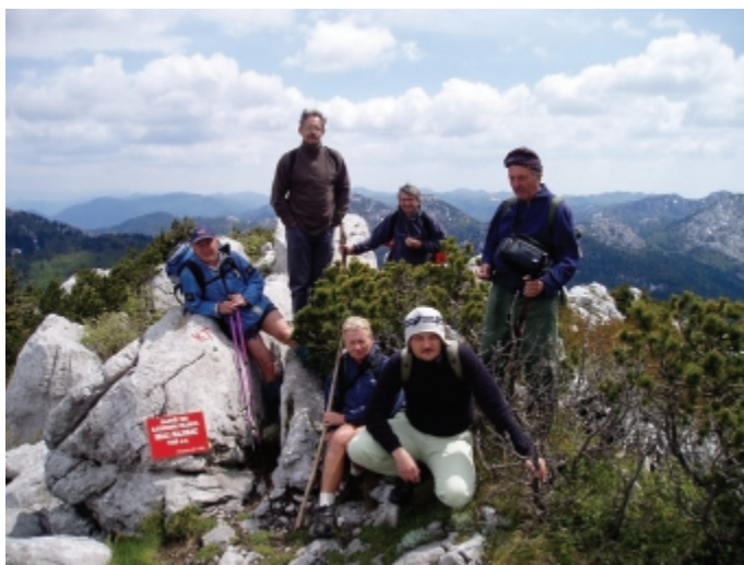
A Mali Rajinac (1699 m) csúcsán