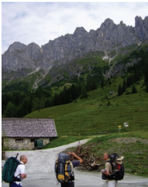
Indulás a hegyre! Háttérben a Mandlwand

Az ország három részéből, négyen indultunk a kalandra. A létszámot az autó mérete korlátozta. Tekintettel a hosszú autótúra, ennyien fértünk el kényelmesen. Távirati stílusban az oda-útvonalt: Budapest – Egyházaskesző, másnap hajnalban tovább Egyházaskesző – Rábafüzes határátkelő – Graz – Klagenfurt – Villah – Mühlbach am Hochkönig, majd a hegyre fel egészen az Arthurhaus