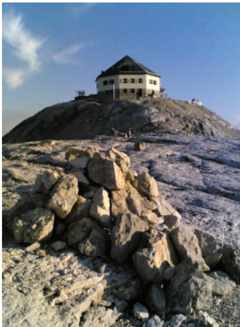
Várként magasodott előttem a Matrazhaus...

Igazán ekkor jutott el a tudatomig, mit is látam a tetőn, amikor oxigén után kapkodva felértem a házba. Rögvest kirohantam felderíteni az áramforrást. A szürkület miatt sokra nem jutottam, de annyi azért látszott, hogy elektromosáram termelésre napelemek, melegvíz készítésére pedig napkollektorok voltak felszerelve. Érdekes. Volt pénz ezen innováció megvalósítására. Úgy látszik, idáig nem ért fel a gáz és olaj maffia civilizációt behálózó csáprendszer.