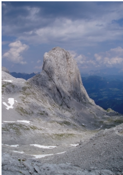
A kőbánya hangulat kapuja. A Torsale kúpja „előlről és hátulról”

Ekkor már a kakastarély szerű hegyvonulat (Mandlwand) másik oldalán gyalogoltunk a Torsale irányába. Ezt a messziről is jól látható, kúposan kiemelkedő sziklát meg kellett kerülni. Attól a magasságtól kezdve olyan volt az utunk, mintha elhagyott kőbányán keresztül haladtunk volna. Ebben az egyenszürke élettelen világban, - ahol csak a piros turistajelzés, és magasabbra érve a hófoltok látványa jelentett változatosságot, - bekövetkezett a „majd meghalok 1. szakasz”. Az unalom, a fáradság, a ritkuló levegő miatt egyre nehezebben, társaimtól lemaradva kapaszkodtam felfelé. Mivel a rosszat is lehet fokozni, a fejem fölött elborult égből eleredt az eső. Megérkezett a pillanat, amikor megkérdőjeleztem az elméleti állapotomat. Mivel sosem állítottam, hogy normális vagyok, gyorsan felvettem az esővédő ruhámat, a hátizsákomat is szépen beöltöztettem és folytattam az utamat.