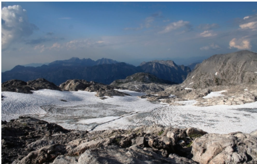
Téli hangulat a nyárban, az Übergossenealm

Fáradtság ide vagy oda, a jobb nézőpont érdekében közelebb ereszkedtem és készítettem néhány emlékképet. Aztán ráérezkedtem a kb. 2700 méter magasan elterülő fehér paplanra. Kénytelen-kelletlen gázoltam át a havon és bosszankodtam, hogy a bakancsomba mindig belemegy hó. Az Übergossenealm gleccseren felmenet végül ismét sziklákon vezetett az utam, majd létrákon felkapaszkodva elérkeztem a menedékház előtti platóra.