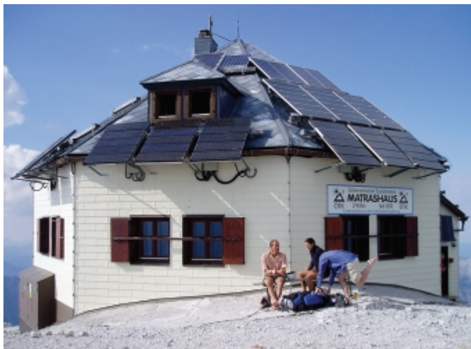
Az enenergia-termelés látható eszközei a Matrazhaus tetején