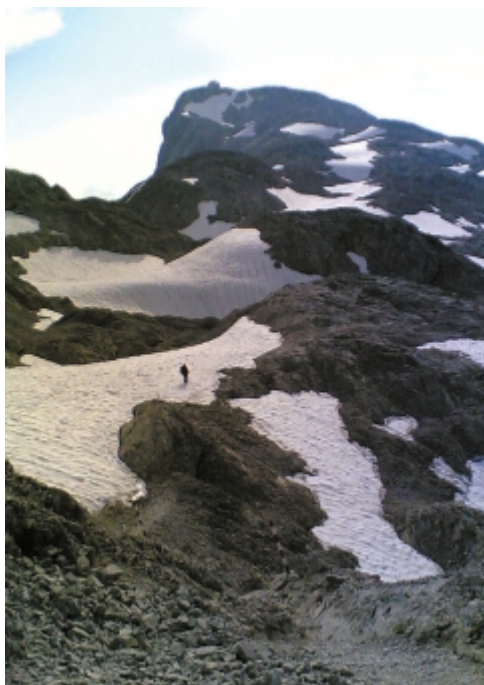
A hegycsúcson, az a kis háromszög tetejű valami a Matrazhaus

amikor megpillantottam a hegycsúcson sütkérező Matrazhaust. Szinte karnyújtásnyira látszó-dó célom a valóságban még elég messze volt. Ennek ellenére, azonnal jobb kedvem lett és az iménti ostoba gondolataim egy szempillantás alatt eltűntek.