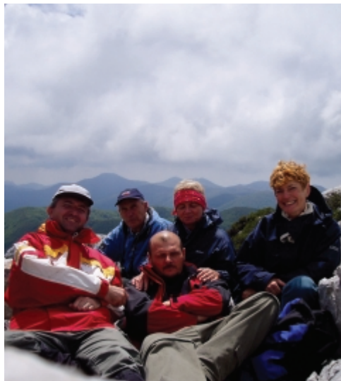
A Veliki Kozjak és a csúcsfotó

Az erdészháztól két és fél óra alatt jutottunk a Veliki Kozjak alá, és kevés sziklamászással feljutottunk a szédfító panorámát nyújtó csúcsára. Rövid pihenő után visszaereszkedtünk a nyeregbe, és onnan megmásztuk az Obli kukot. Az itt említett csúcsok érintő pontjai a Velebiten lévő túramozgalmaknak. A Veliki Lubenovac hatalmas havasi rétvén ebédeltünk és rendeztük a sorokat, majd irány a Hajducki kuk 1649 méter magas sziklás csúcsa. A nyár ellenére hatalmas hófoltokon baktatva, kőfolyásokon kapaszkodva jutottunk egy közel 150 méter mély töbörhöz, majd meredek kaptatóval a csúcsra. Csúcs fotó, csúcs csoki, kis pihenő, s irány a lejtő. Lejtmenetben rosszabb volt, mint a hegymenet... De ez már csak így szokott lenni. Itt jelentkeztek az első „sebesülések”, mint például „kézkihűlés”, „fenékbevágó nadrág”, „folyamatos túrabot kopás”, „sör elfogyás”, „bepárasodó szemüveg”, stb... A Veliki Lubenovacra való lejutásunk után többen a „talpunkt igazgattuk”, de irány a kocsí, mert aludni mégis csak Krasnon kell. Az este a szokásos módon telt, mind például kézmosás, kolbász fogyasztás, „oszt” fürdés, majd az aktuális sütik elfogyasztása, a Velebit Likőr „párolgásának”, torokkal történő megakadályozása.