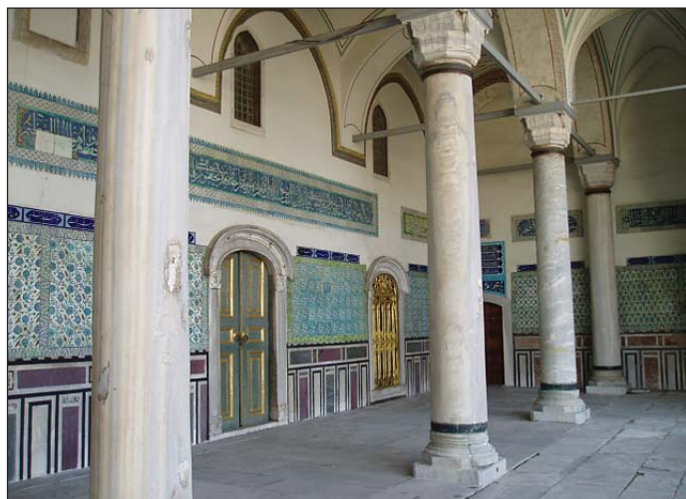
Aja Sophia belső

A Topkapi palotát elhagyva utunk az Aja Sophia székesegyházba vezetett, amely a keleti kereszténység legnagyobb és legrégebb emléke. Megrázó élmény volt a székesegyházba lépve, a híveket imára hívó müezzin hangja fogadott. Hirtelen átfutott az agyamon vajon mit élhettek át azok a