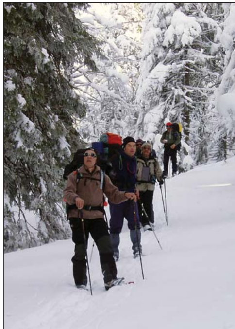
Behavazott fenyvesek a Paptüdője-nyeregben

Vámos László barátunk helyszín és időpont választása remekül sikerült, mikor a Bihart választotta a hótalpas túrára. Két autóval, 9 fővel indultunk, s bár meggyötört minket a hótaposás és az utolsó napi esőzés, lélekben felfrissülve tértünk vissza a hétköznapok Magyarországaiba... (2. old.)