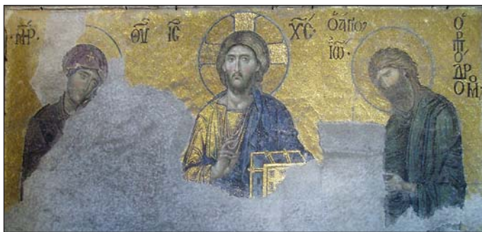
A „trónoló Krisztus” az Aja Sophia-ban

mind, ha vibrálna a dzsámi belső tere. A Sultanahmet megtekintése után átsétáltunk a Topkapi palotába, amelyet nem sokkal Konstantinápoly meghódítása után, 1459-1465 között II. Mehmed építtetett. A Topkapi palotának négy udvara van, amely gyakorlatilag a nomád oszmánok régi táborhelyeinek kőből kialakított változata. A palota a szultánok lakhelye és a kormányzás székhelye volt. Leginkább érdeklődést kiváltó épületek a palotában az un. Divan, amely teremben gyűltek össze a birodalmi tanács vezírei. A Kincstárban az oszmán birodalom legszebb ékszerei találhatóak, míg a „Szent köpönyeg” teremben az iszlám legszentebb ereklyéit csodálhattam meg. Ezen szent ereklyék I. (Kegyetlen) Selim szultán hódításai után kerültek Isztanbulba.