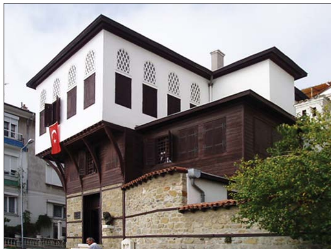
Rodostó, Rákóczi ház

A templom északnyugati és nyugati sarkaiban két márványurna van, valószínűleg a hellenisztikus vagy kora bizánci korból. Az egyik urna mögötti téglalap alakú oszlop „Csodatévő Szent György oszlopa”, amely állítólag gyógyító erővel hat. A „Katonák csarnokába” belépve forduljunk hátra, mert itt található a templom egyik legszebb mozaikja. A mozaikon Szűz Mária Justinianussal és Constantinnussal látható.