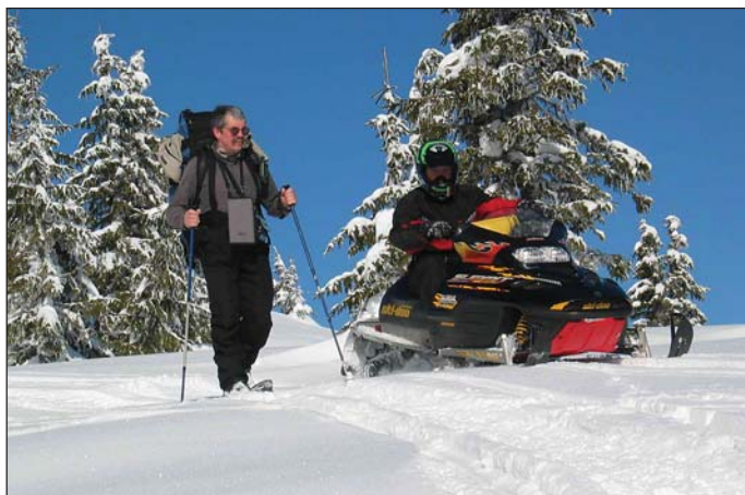
Gyalogosan vagy motorosan jobb a túra?

A „hószánok” nyomai a gerinc-re vezettek, s mi bőszen tapostuk a havat, s majd egy óra múlva értünk fel a Mező-havas 1627 méteres csúcsára. Az időjárás a kegyeibe fogadott minket, nap-sütéssel és remek panorámával ajándékozta meg a vándorokat. Az Istenek-havasát „megoldalztuk”, de a „homlokán” lévő sziklavilág megér egy külön napot. Úgy gondolom, egy nyári túra alkalmával veszélytelenül bejárható az Istenek-havasának sziklavilága.