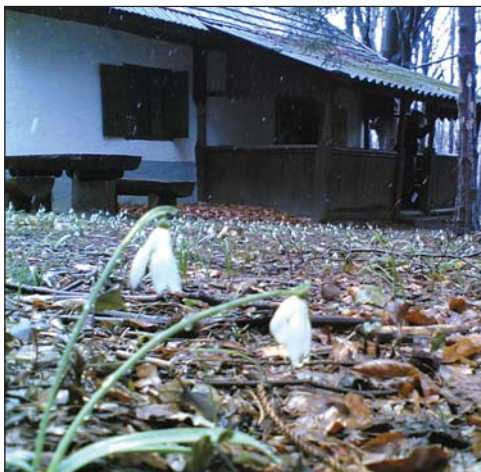
Az Őrkő ház körüli didergő hóvirágos mező