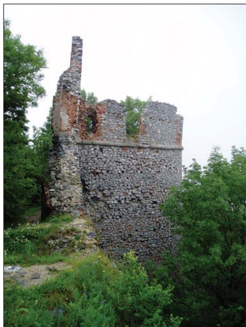
A külső vár félköríves bástyája