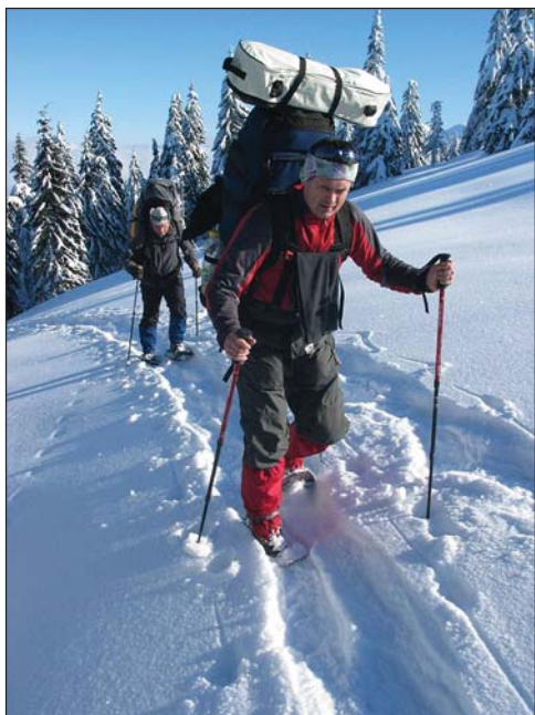
Hótaposás a gyakorlatban

fenyvesvel benőtt gerincszakaszra, merre is menünk kéne! Szó, szót követett, majd „korrigáltunk” és úttalan utakon, a GPS iránymutatását követve bukdácsoltunk a fenyvesben. A Kis-havas déli oldalában állítottunk sátrat.