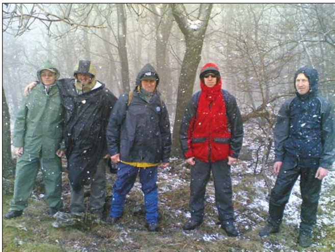
Hóvihar a 880 m magas Őrkő tetején