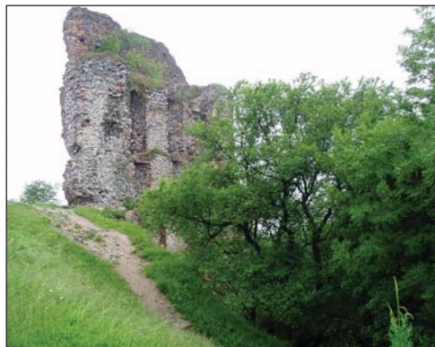
Több emeletnyi magas falak

Borostyánkő eredete a XIV. század közepére nyúlik vissza, valószínűleg az elpusztult Stomfai (Stupava) vár pótlása céljából építették. Kezdetben egy osztrák család birtokolta, majd Zsigmond királyé lett 1349-ben, aki a pozsonyi ispán fennhatósága alá rendelte 1386-ban. 1442-ben