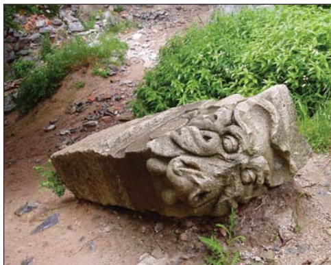
Leszakadt oroszlánfejes pillér