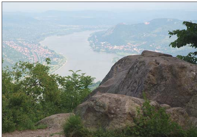
Utunk csúcspontja a Prédikálószték

„Elég hosszú tanakodás előzte meg a közgyűlés időpontjának és helyszínének kiválasztását. Az én javaslatom volt Dobogókő, ellenjavaslat nem érkezett. Mióta elnökké választott a tagság, az volt