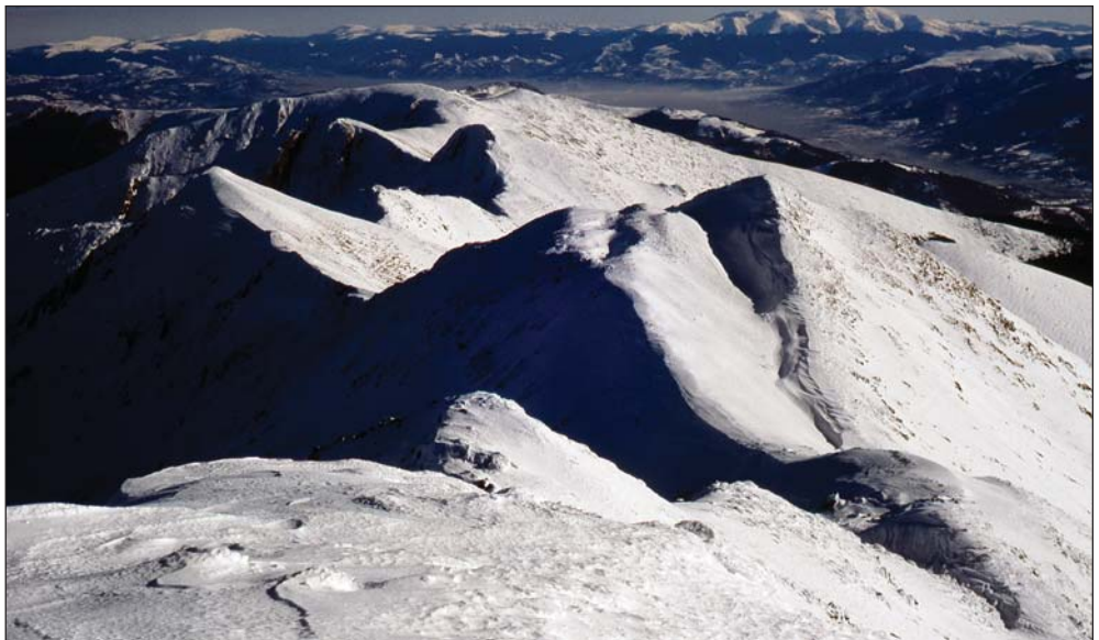
Téli Retyezát panoráma.

( http://www.iit.bme.hu/mtsz/mhk/csarnok/b/barcza.htm )