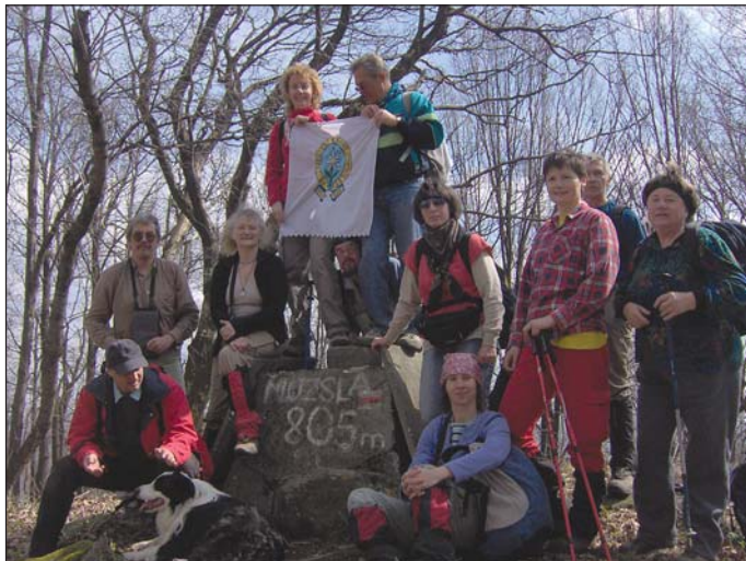
Muzslai csúcspotó (805 m)