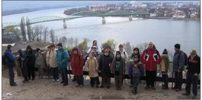
Az ostromló sereg

A tavaszi tél után megjött a télies tavasz, így márciusi túránk kőfalak közé záratt. Mivel várhódításban már profik vagyunk, ezért Esztergomot céloztuk meg. Termé-