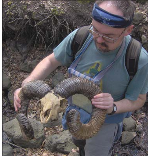
Az értékes muflonfej