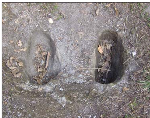
A török lábnyoma